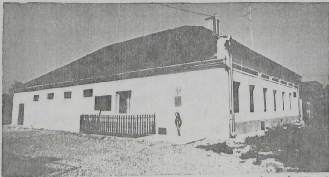
A felújított abdai művelődési ház látképe

Kunszigeten a tanácstagok és a Hazafias Népfront bizottsági tagjainak közreműködésével MEGKEZDŐDÖTT A GYÜJTÉS a II. Világháború áldozatai emlékművének elkészíttetésére. Az emléktábla a templom falában kap helyet. Kivitelezésre a megbízást már megadta a Hazafias Népfront, a mű készül, felavatására november elseje körül kerül sor. Kérjük a község lakosságát, hogy anyagi helyzetéhez mérten mindenki adakozzon e nemes cél érdekében.