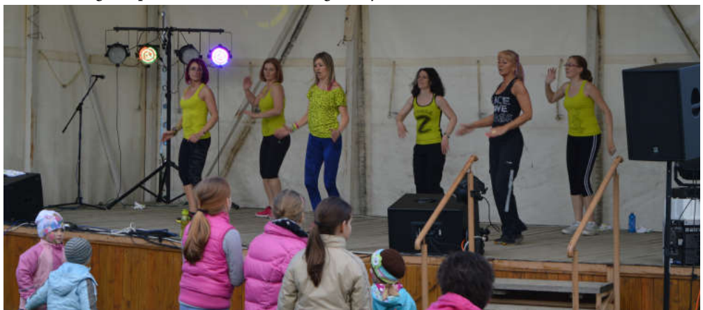
Zumba a sportálya színpadán a kunszigeti majálison.

Kiadja a Kunsziget Község Önkormányzata 9184 Kunsziget, József A. u. 2. Felelős kiadó: Lendvai Ivánné, Tel.: 96/485-388, 30/226-97-30 e-mail: polgarmester@kunsziget.hu Felelős szerkesztő: Szalai Sándor Tel.: 96/485-736 Tördelés: Bábits Norbert. Készült a PicArtShow Kft. nyomdájában 450 példányban.