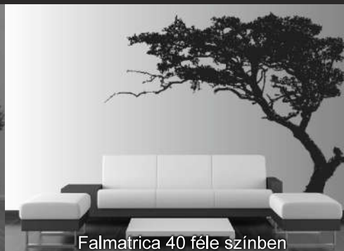
Falmatrica 40 féle színben