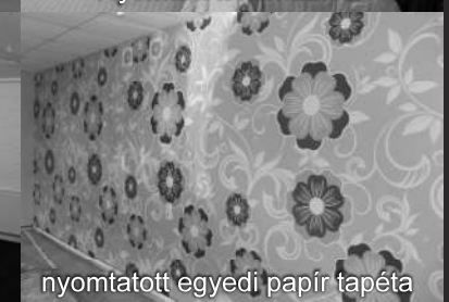
nyomatott egyedi papír tapéta