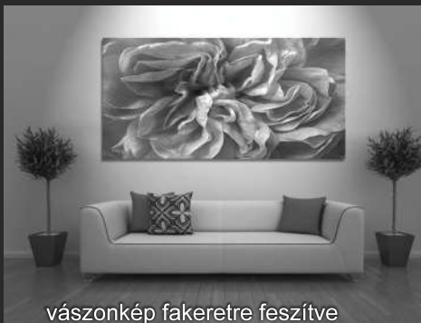
vászonkép fakeretre feszítve