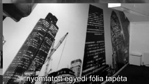
nyomatott egyedi fólia tapéta