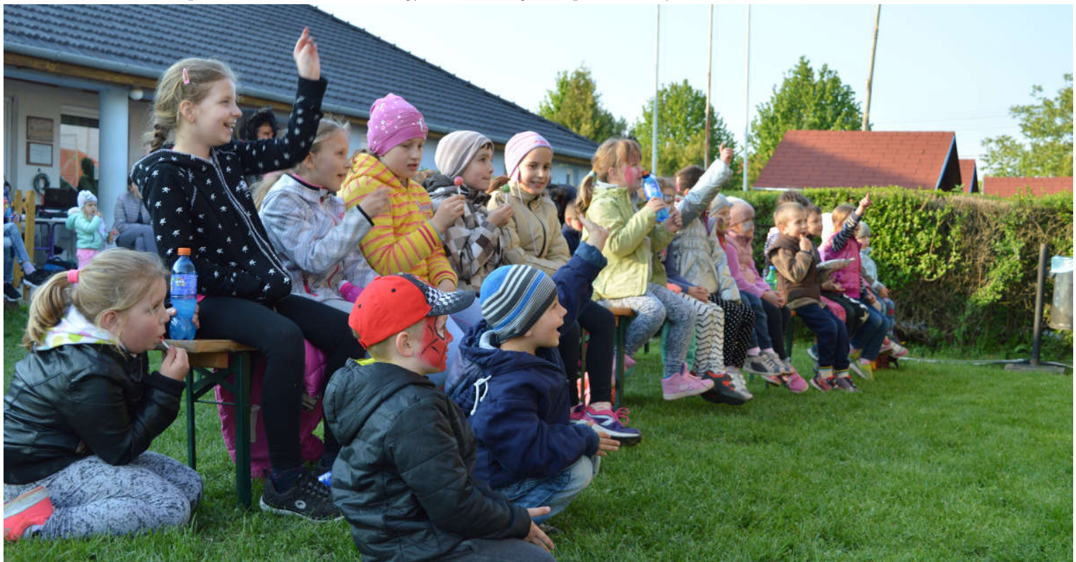
A Csemete Bábszínház lelkes közönsége az április 29-én rendezett kunszigeti majálison.