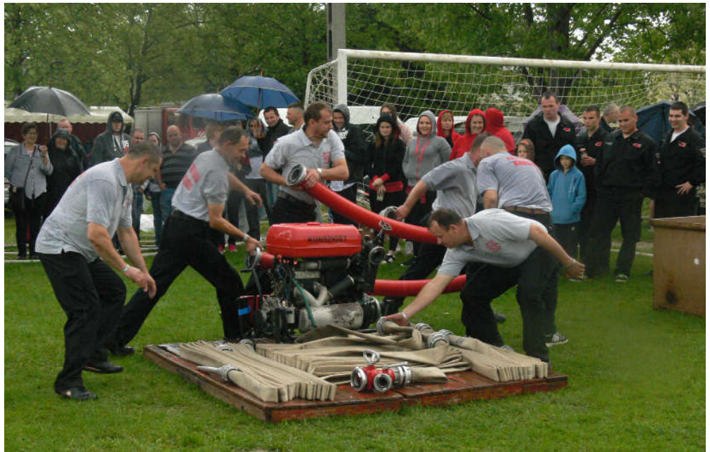
A kunszigeti szenior csapat szerelése a pannonhalmi tűzoltóversenyen.

Pannonhalmán rendezték május 13-án a 2017-es tűzoltóversenyt a Győr környéki önkéntes tűzoltó egyesületek részére. Kunsziget hét csapattal képviseltette magát a versenyen, és szinte minden csapatunk dobogós helyen végzett valamelyik versenyszámban.