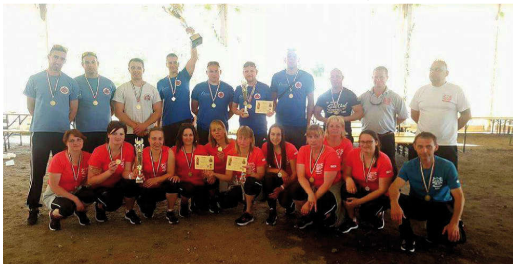
A kunszigeti női csapat és a győri hivatásos tűzoltók csapata a pilisszentiváni országos versenyen.