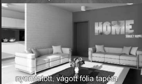
nyomatott, vágott fólia tapéta