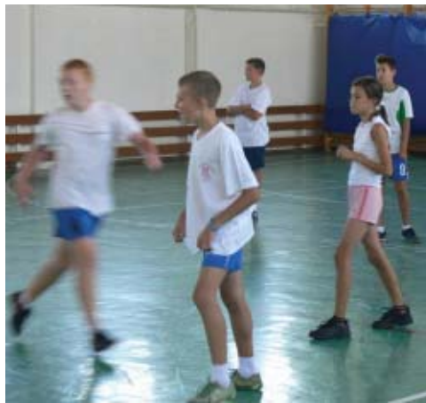
A futáson részt vesznek az iskola hatodik osztályos tanulói is.