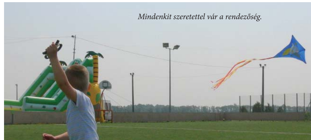
Mindenkit szeretettel vár a rendezőség.