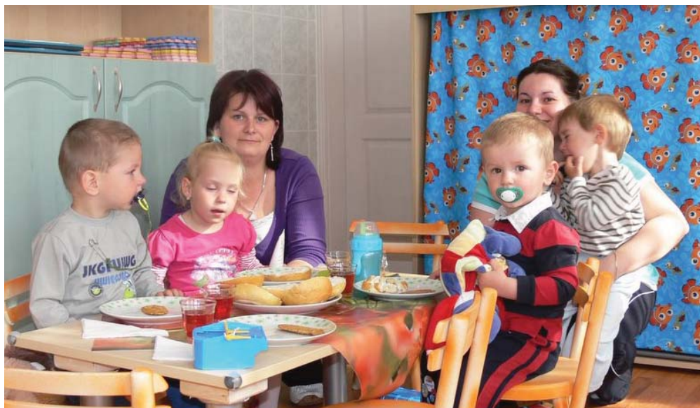
A működés második hetében hét kisgyermek felügyeletét látta el a Manóvár.