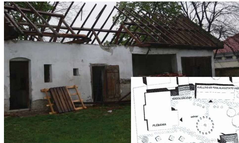
A felújítás megkezdődött, a tervek szerint az udvar több tevékenységnek is helyet ad majd.