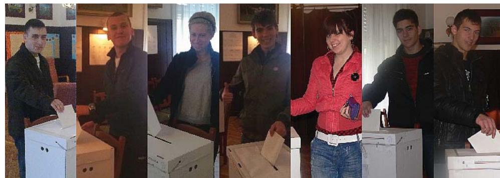
A képeken az első választó kunszigeti fiatalok egy része adja le szavazatát

A listás szavazatok között a Fidesz-KDNP kapta a legtöbb szavazatot Kunszigeten, 407-et, a Jobbik 98, az MSZP 96, az LMP 39, az MDF 19, a Civil Mozgalom 7 szavazatot kapott.