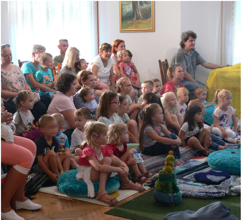
A Süss fel, nap! című előadásra is sok kisgyermekes család volt kíváncsi.

Végezetül szeretnék mindenkinek kellemes nyári időtöltést kívánni tartalmas programokkal, sok pihenéssel egybekötve.