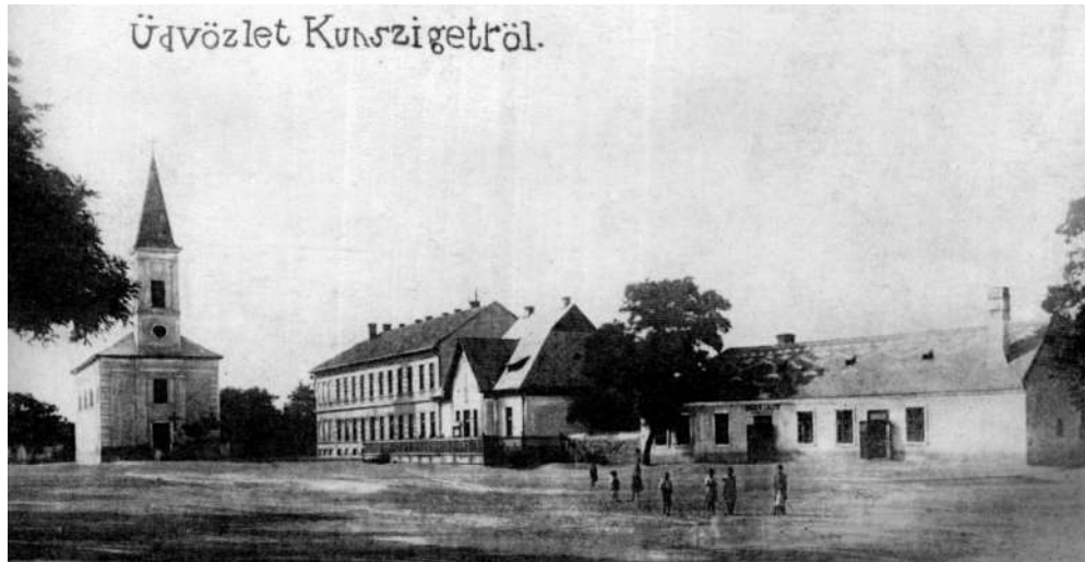
Kunszigeti képeslap a XX. század elejéről. Balra a templom, mellett az iskola és a plébánia épülete.

A templomszentelést követő esztendőben új padokat csináltatott, majd azokban név szerint kijelölte a férfiak és az asszonyok ülőhelyeit. Egy bőrkötéses könyv lapjaira berajzolta a padokat és beírta, hogy kinek hol kell ülnie. Ebből a könyvből az utókor megtudhatja azt is, hogy 1845-ben milyen nevű családok éltek Szigetben. Majd 1846-ban, közadakozásból elkészíttette és felállíttatta a templom bejárata előtti nagy márványkeresztet. Pongrácz István csak tíz évig lehetett a szigeti plébánosa, mert 1852. december 5-én meghalt.