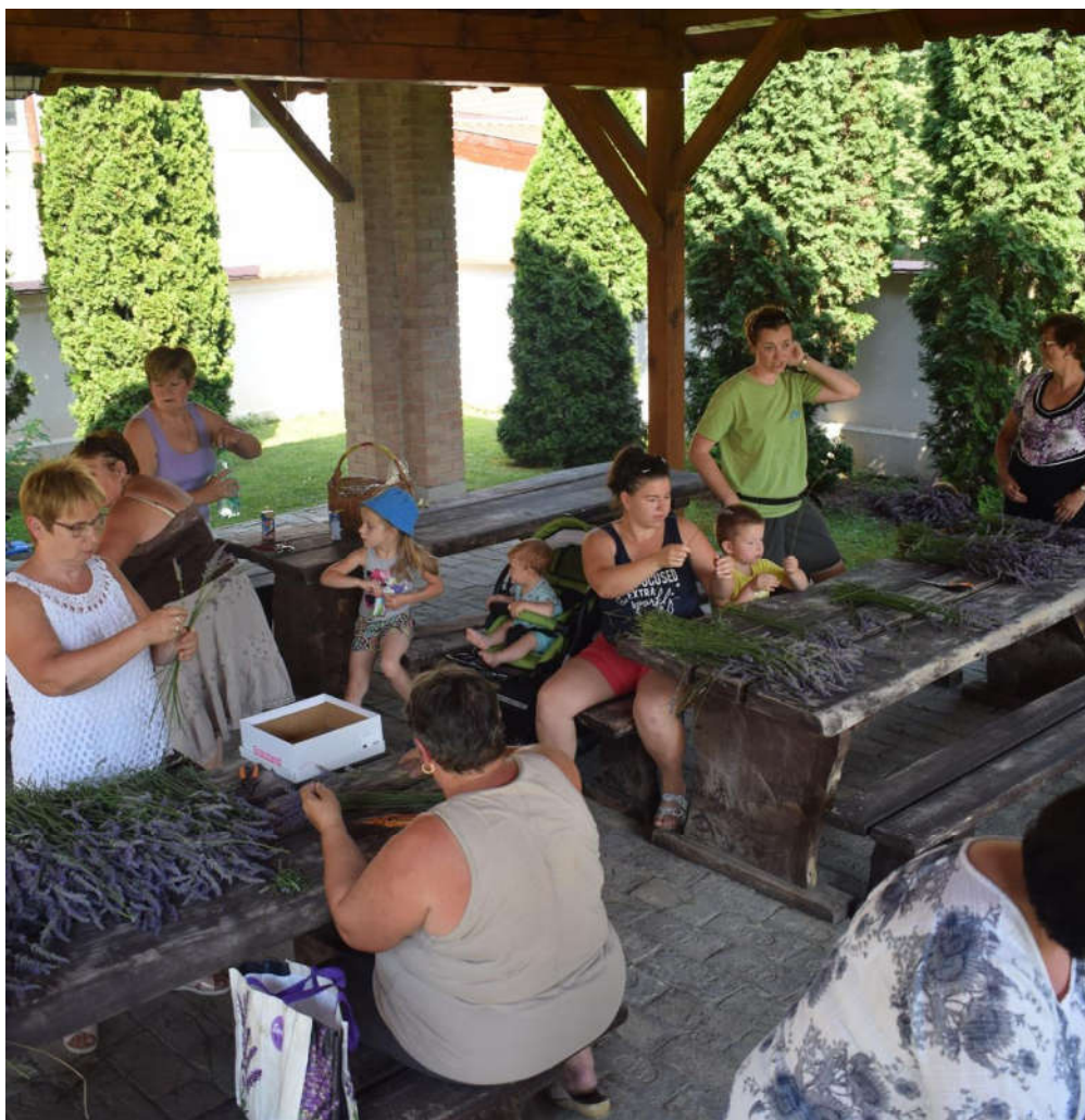
A csodálatos levendula címmel munkadélutánt szerveztünk a plébánia udvarán.