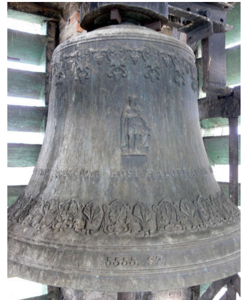
A templom kisebb harangját 1930-ban öntötték.