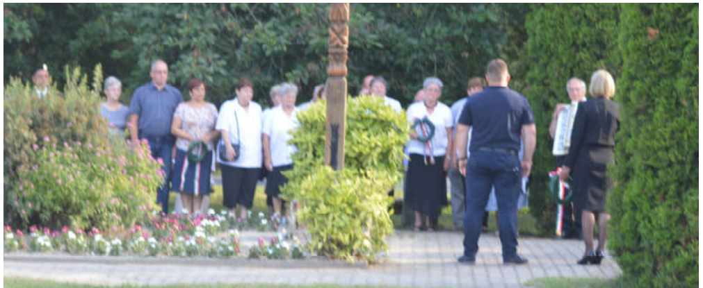
A Nemzeti Összetartozás Napján irodalmi-zenés emlékműsorral emlékeztünk meg a trianoni döntés évfordulójáról, és megkoszorúztuk a Kossuth téri emlékoszlopot.

Kiadja a Kunsziget Község Önkormányzata 9184 Kunsziget, József A. u. 2. Felelős kiadó: Lendvai Ivánné, Tel.: 96/485-388, 30/226-97-30 e-mail: polgarmester@kunsziget.hu Felelős szerkesztő: Szalai Sándor Tel.: 96/485-736 Tördelés: Bábits Norbert. Készült a PAS Reklám Kft. nyomdájában 450 példányban.