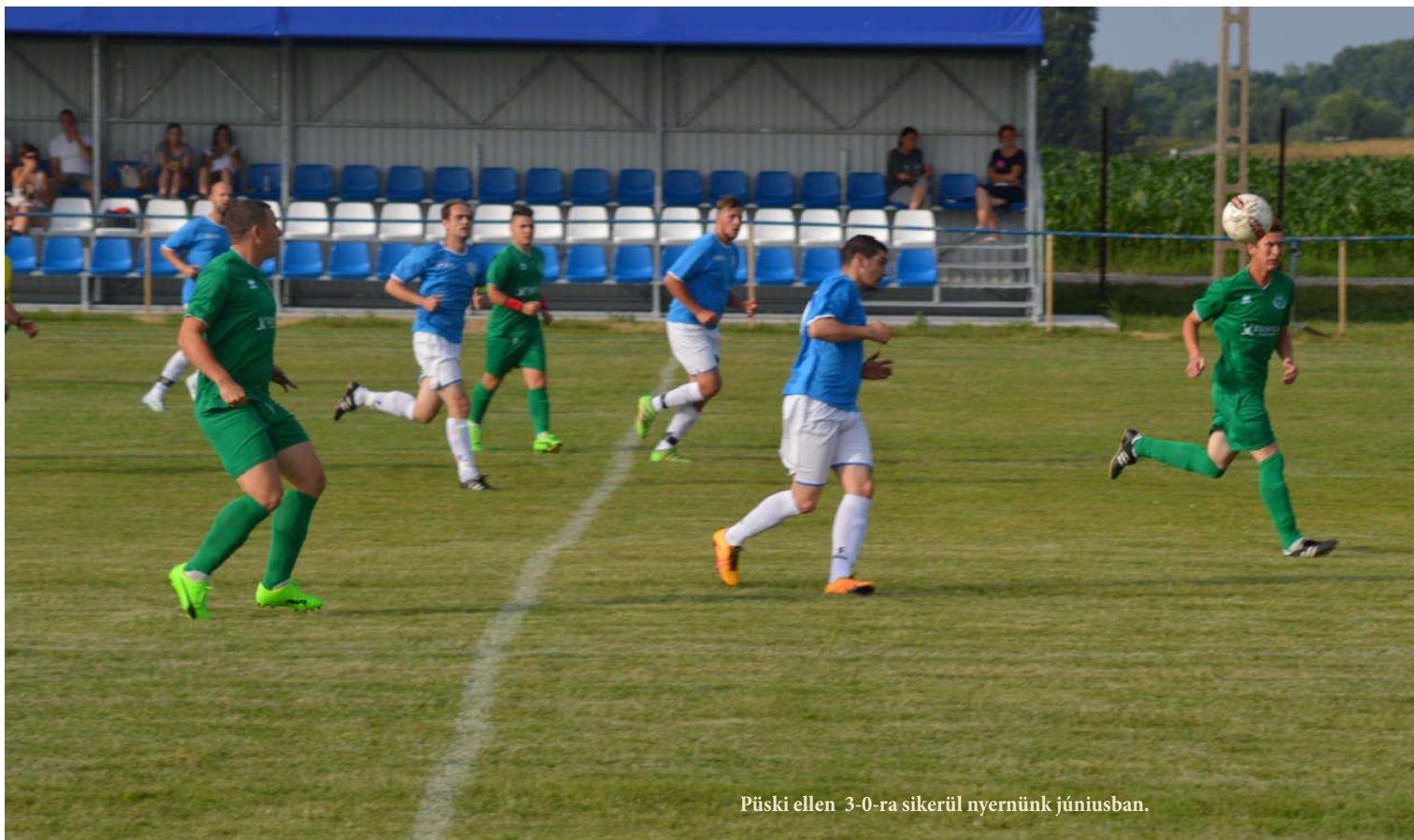
Püski ellen 3-0-ra sikerül nyernünk júniusban.