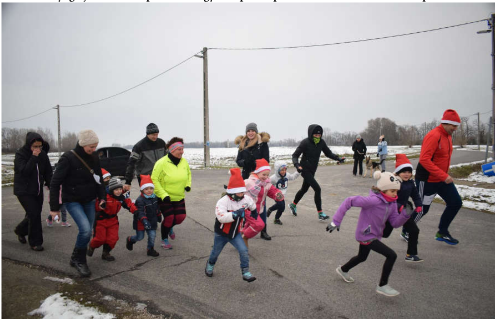
A Federal Mogul Hungary Kft. felhívására lelkes óvodások szüleikkel futottak együtt a Mikulás-futáson.