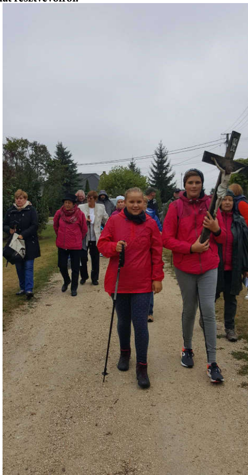
Előtérben a legfiatalabb gyalogos zarándokok.

Bízunk, hiszünk, és remélünk, hogy életünket jobbra imádkozhatjuk, magunkhoz képest magasabb szintre emelhetjük.