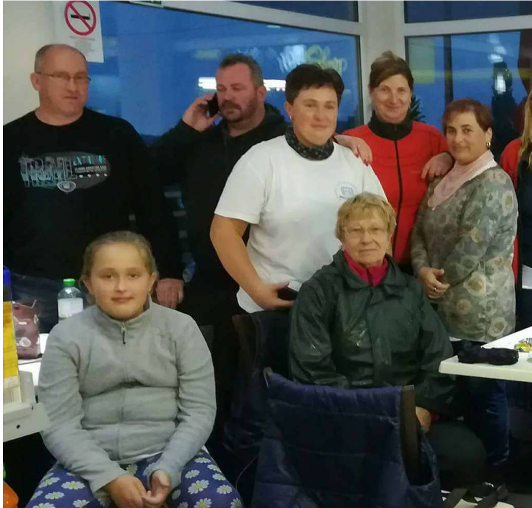
Csoportkép a zarándoklaton.

Elindultunk, hogy mire a nap felkel és Máriakálnok magaköré gyűjti a környező településekről a híveit, mi is ott legyünk. Máriánál. A kálnoki Szűzanyánál. Hiszen oda indultunk. Fohászkodni hozzá, hálát adni Neki, letenni a lábaihoz a terheinket amiket hordoztunk. Útközben rácsodálkozhattunk a minden órában más-más arcát mutató teremtett természet szépségeire. A „hátizsákban” többek között elvittük a meg nem értettség „bábel tornyát”, imádkozva azért, hogy végre értsük egymást, és legyen béke mindenhol a világban. Imáink gerincét a rózsafüzér titkok imádkozása alkotta. Felváltva mondtuk felajánlva a nekünk legdrágábbakért, a gyermekeinkért, családjainkért, itthon maradt testvéreinkért, barátainkért akik erre kértek bennünket, bár tudták, tudtuk, hogy nehéz lesz az a teher amit cipelnünk kell az úton. Mégis elvittük a ránk bízottak, és a saját magunk gondját-baját és háláját. A hagyományokhoz híven, most is derüsen, kitartóan meneteltünk- az utat végig imádkozva, beszélgetve, néha csendben, néha énekelve, egymást biztatva, hogy már nincs sok a célig.