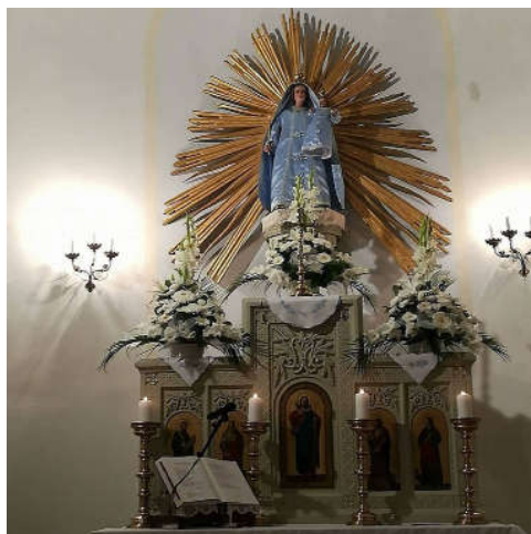
Oltár a máriakálnoki templomban.

Mint az életünk... olyan az út is. Néha csendesen, vagy éppen társalkodva, néha gondolatainkat megosztva együtt haladtunk valakivel, és olyan is, hogy lemaradtunk...magányosan lépdelve. Mert épp ezt kívánta meg a lélek. Kell a megtisztuláshoz a magunkhoz fordulás, és ehhez kell az elcsendesedés. A lélek túlcserélése igényli a „karbantartást”. A hétköznapijaink gondokkal telítettek, túlhajszolt életünkben ezért kell, hogy legyen néha megállás. Ezért vágyakozik szívünk az ilyen „lelki utazások” után, ezért indulunk el, sajnos csak nagyon ritkán egy zarándoklaton.