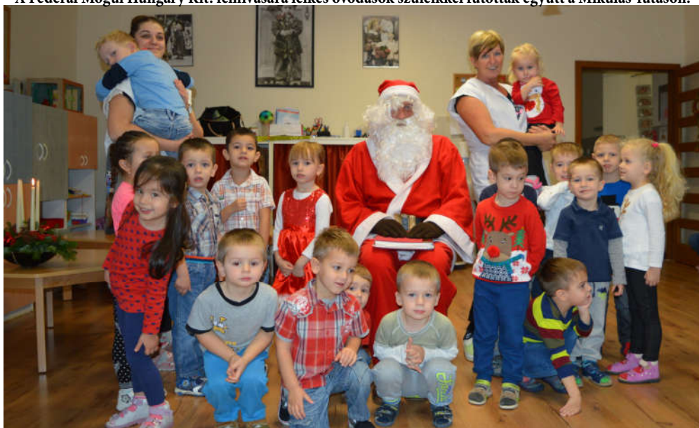
A jóságos Mikulás a kiscsoportosoknak is hozott ajándékot.