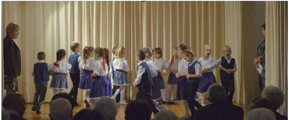
A Tündérvár Óvoda óvodásai szívet melengető műsorral köszöntötték az időseket.

Az idősek napja kiváló alkalom arra, hogy felülvizsgáljuk öregeink irányába tanúsított, néha-néha bizony elmaradó gondoskodásunkat.