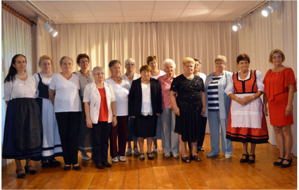
Az idei mesemondó- és anekdota verseny résztvevői.

Forrás Ferencné szólította egymás után a fellépőket a színpadra és egyszerre a csodák birodalmába csöppentünk. A mesék szöveg- többek között- a félig nyúzott bakkecskéről, Pityi Palkóról, a rátóti csikótojásról, Bohókáról és Katókáról, a rózsát nevető királykisasszonyról, a fábólfaragott Péterről.