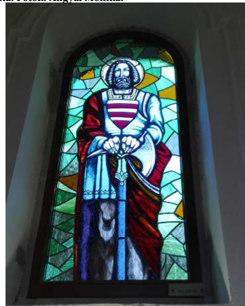
Szent László ablaka.