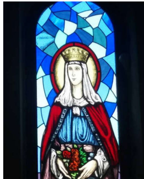
Árpád-házi Szent Erzsébet ablaka.