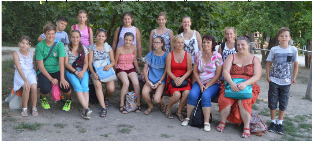
Erdélyi és kunszigeti diákok és pedagógusok Budapesten, a János-hegyen.