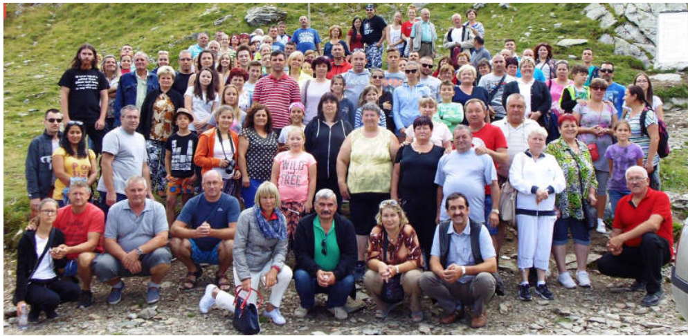
Csoportkép 2042 méteres magasságban, a Transzfogarasi úton.