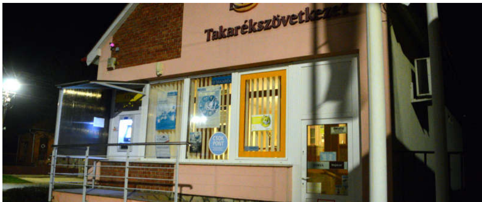
- LENDVAI IVÁNNÉ -

A Lébény-Kunsziget Takarékszövetkezet alapító tagja községünk, Kunsziget.