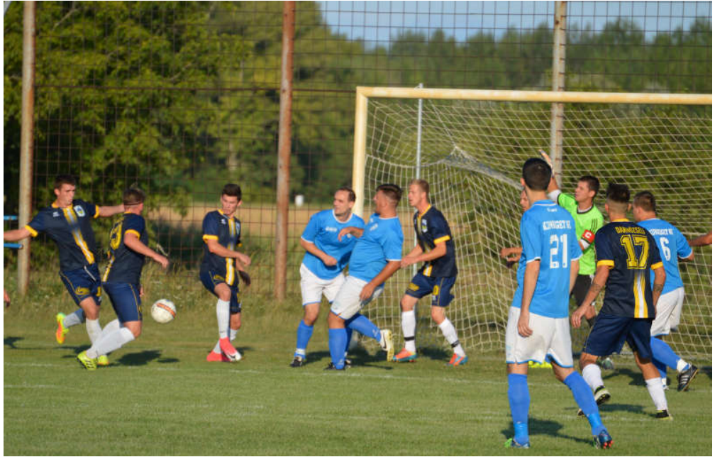
Darnózseli ellen 2-0-ra vezetünk az első félidő után, a meccs végére azonban elfogyott az előnyünk.

Felemás őszi szezon áll a Kunsziget SE első számú csapata mögött: hétszer sikerült nyerni, három döntetlen mellett ötször vereséget szenvedett az együttes. Voltak magabiztos győzelmek (hazai pályán Győrsövényház, Ásványráró ellen, illetve idegenben Levélen), és utólag bravúrosnak mondható győzelem is, hazai pályán, a Dunakiliti ellen. Voltak ugyanakkor olyan pontvesztések, ahol már nekünk állt a zászló (döntetlen Darnózseli és Kimle ellen), és olyan meccs is, ahol hajszálon múlt csak a meglepetés (az őszi bajnok Mosonszentmiklós ellen). A másik véglet pedig az olyan érthetetlen vereségek jelentik, mint amit Dunaszeg vagy Máriaikálnok ellen szenvedtünk el hazai pályán. A középmezőny sűrű, a 4. helyen álló Dunaszeg csak 6 ponttal előz meg minket, ugyanakkor a 12. helyen álló Károlyháza is épp 6 pontra van mögöttünk. Nagyobb koncentrációval a csapatunk akár a dobogóért is harcba szállhat majd tavasszal.