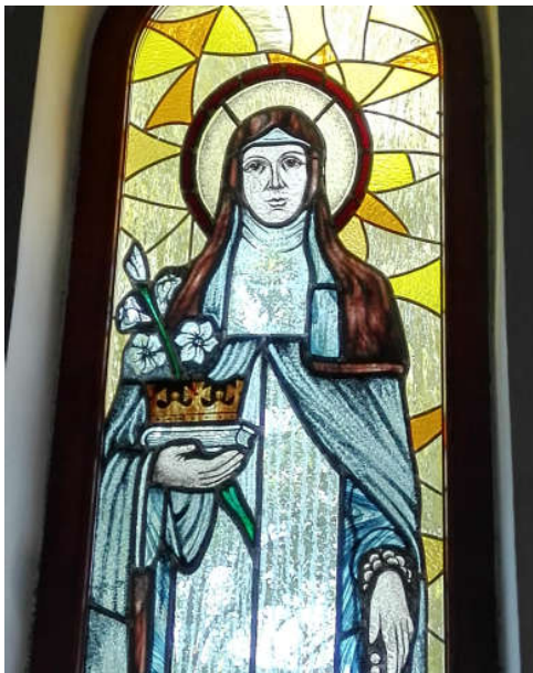
Árpád-házi Szent Margit ablaka.