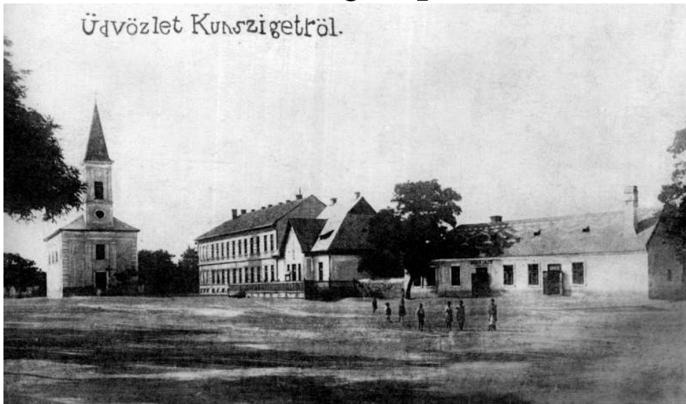
A XX. század elejéről származó képeslap Kunszigetről.