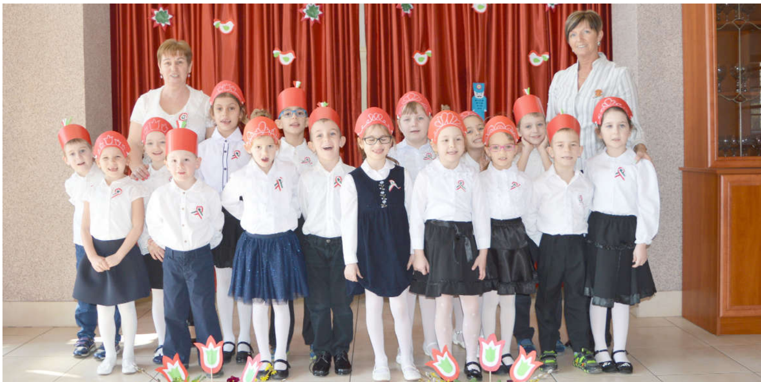
A Tündérvár Óvoda óvodásai március 15-én.