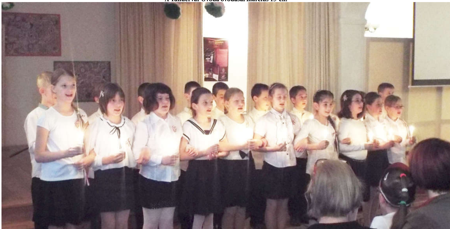
A Kunszigeti Két Tanítási Nyelvű Általános Iskola és Alapfokú Művészeti Iskola negyedik osztályos tanulói a március 15-i ünnepélyen.