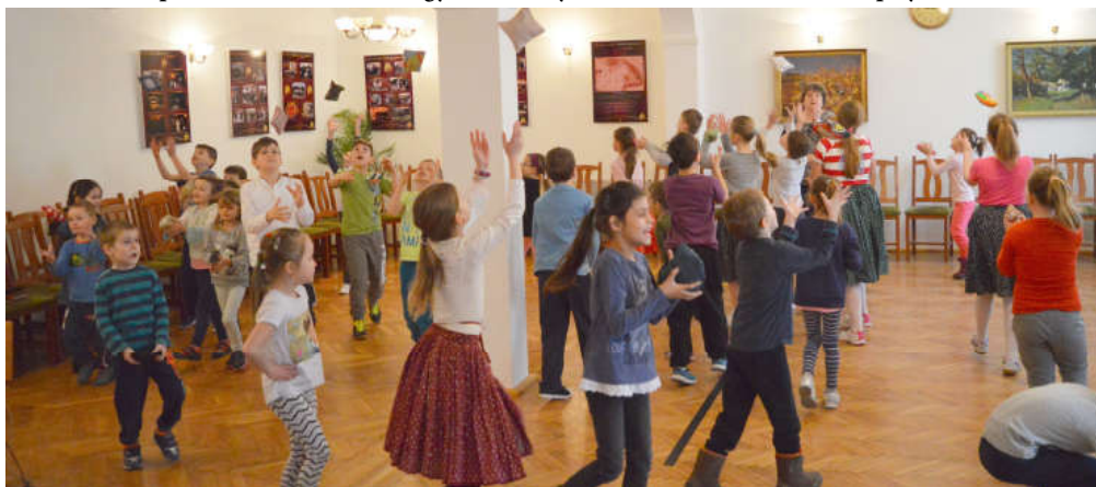
A SULI-HÍVOGATÓ játékos-táncos foglalkozása a kulturházban.

Kiadja a Kunsziget Község Önkormányzata 9184 Kunsziget, József A. u. 2. Felelős kiadó: Lendvai Ivánné, Tel.: 96/485-388, 30/226-97-30 e-mail: polgarmester@kunsziget.hu Felelős szerkesztő: Szalai Sándor Tel.: 96/485-736 Tördelés: Bábics Norbert. Készült a PicArtShow Kft. nyomdájában 450 példányban.