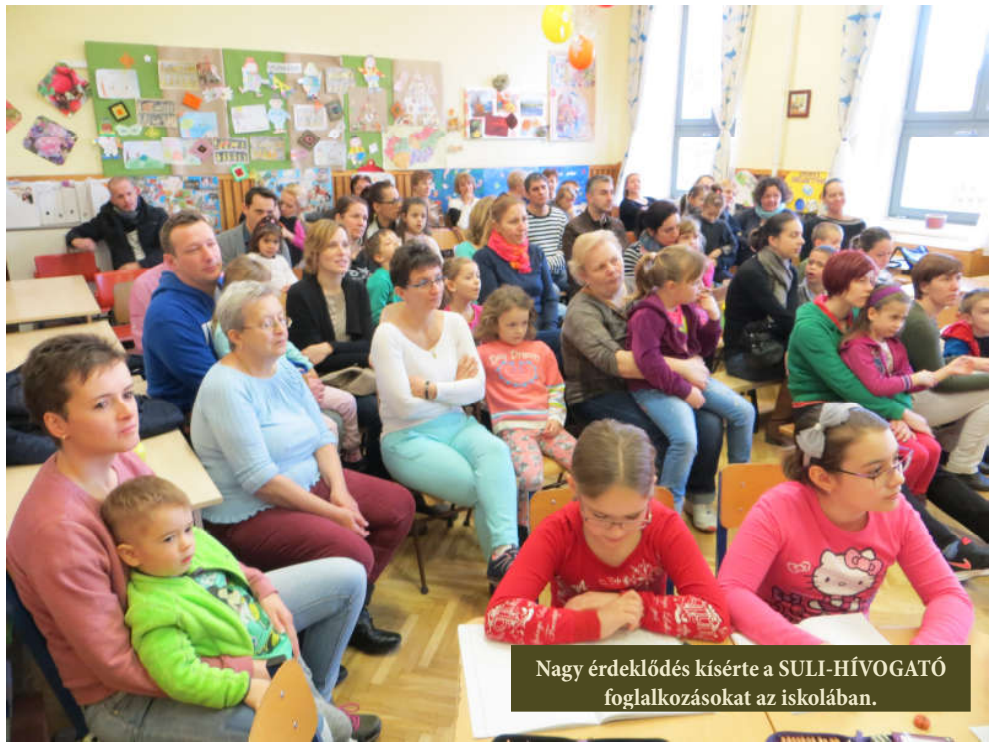
Nagy érdeklődés kísérte a SULI-HÍVOGATÓ foglalkozásokat az iskolában.