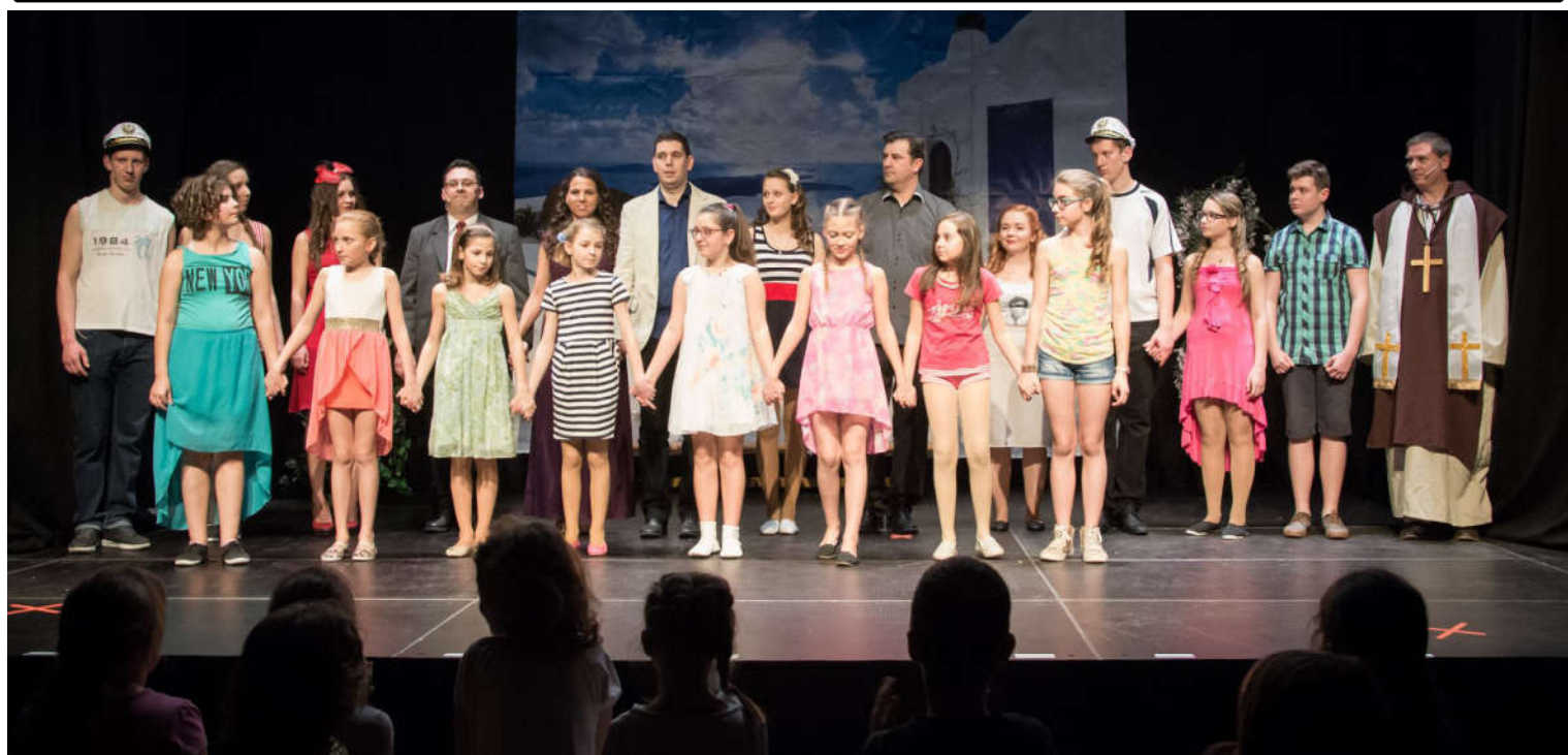
A Dunaszegi Színjátszóköri a kunszigeti sportcsarnokban mutatta be a legújabb darabját. Az előadást több mint kétszázan látták.