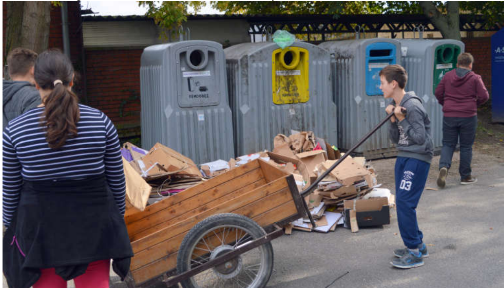
A szervezett hulladékgyűjtésekkel is igyekeznek csökkenteni az érintett települések az illegális hulladéklerakást. Képünk a kunszigeti iskola által ősszel rendezett papírgyűjtésen készült.