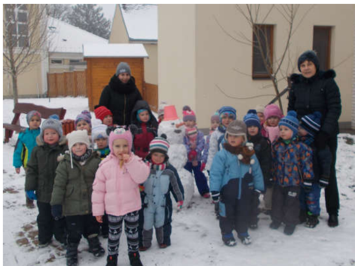
Hóember épült az óvoda udvarán.