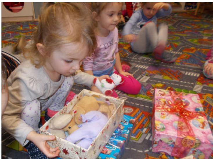
Örömmel játszanak a kunszigeti óvodások a karácsonykor a Federal Mogul dolgozóitól kapott játékokkal. Köszönjük az ajándékokat.