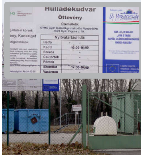
Az ótvevényi hulladékudvarban a legtöbb hulladékot átveszik.