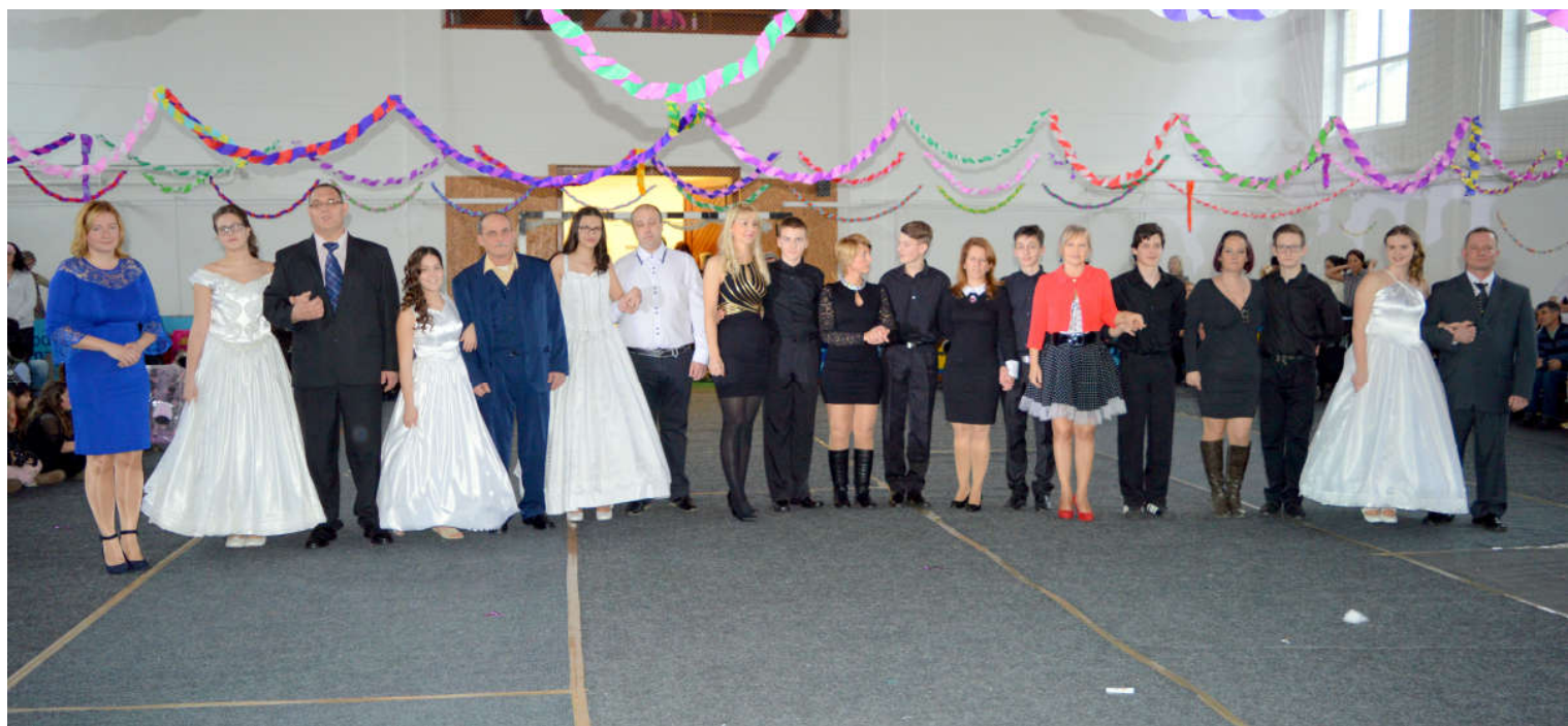
A Kunszigeti Két Tanítási Nyelvű Általános Iskola és Alapfokú Művészeti Iskola nyolcadik osztályos tanulói felelevenítették a hagyományt, és kerengővel készültek az idei farsangi bálra. A tánc második részében a szülei voltak a gyerekek táncpartnerei.