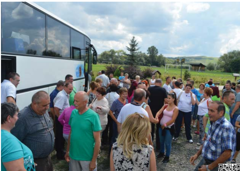
A megérkezés pillanatai: az új vendégeket is ugyanolyan szeretettel köszöntötték, mint a régi barátokat.