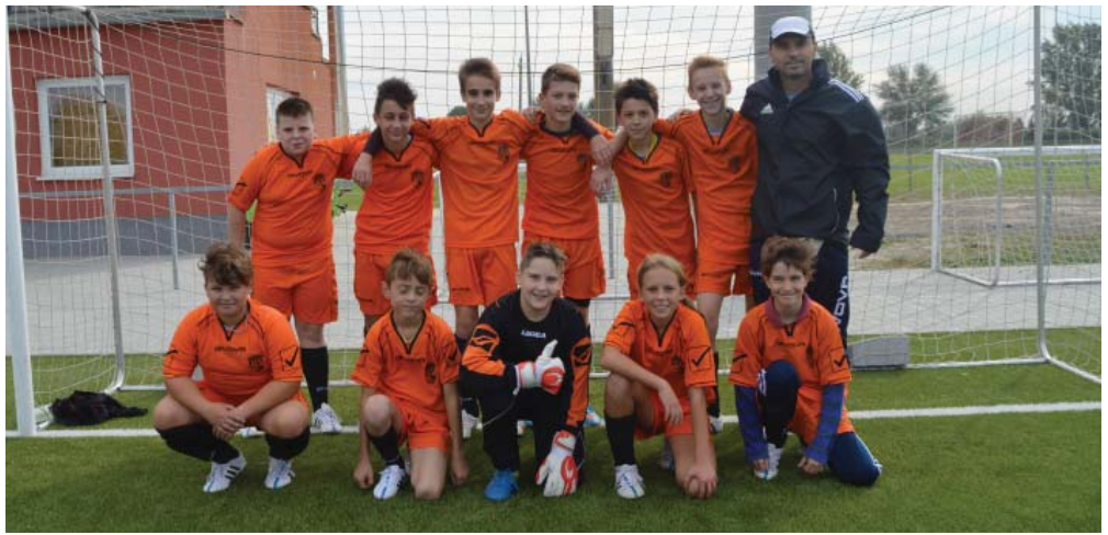
Az U14-es csapat újoncként két győzelmet tudhat magáénak az őszi szezonban.

Amatőr tekebajnokságokat már a '80-as években is rendeztek, aztán egy hosszabb szünet után 2006 óta újra megmérik egymással a baráti társaságokból alakult csapatok, amelyek között akad nem is egy, amely nem csak kunszigetiekből áll. Érdekes tény, hogy a hat olyan csapat is van a mezőnyben, amely már 2006-ban is az indulók között volt: a Fakó, a Kisduna, a Lokomotív, a Múúúúú, az Öreggolyók és a Tökös Tekések.