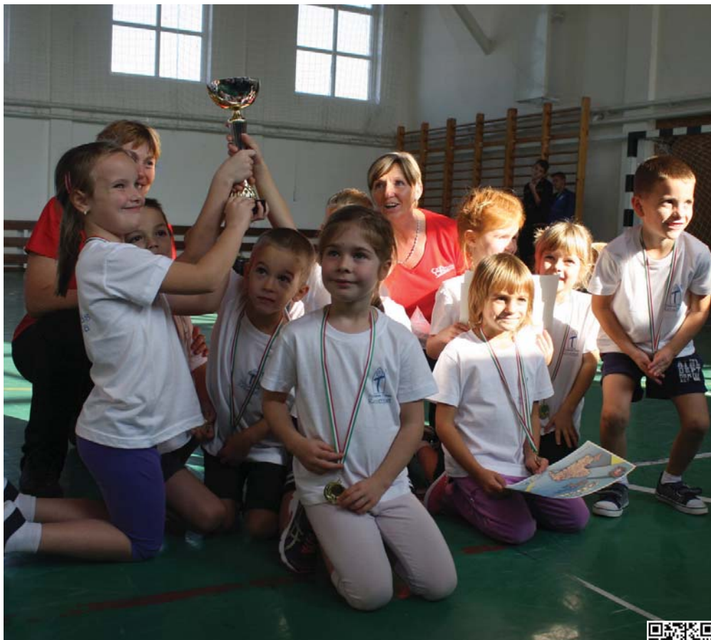
Az Óvodás Olimpián a kunszigeti óvodások nagyszerűen szerepeltek, a sor- és váltóversenyt magabiztosan nyerték, emellett hárman végeztek érmes helyen az egyéni versenyeken.

Áldott, békés karácsonyi ünnepeket, és sikerekben gazdag új évet kívánunk a Tündérvár Óvoda óvodásai és az óvoda dolgozói.