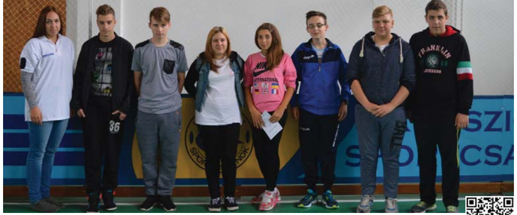
Az iskola és Kunsziget Község Polgárőrségének közös rendezvényén, az Egy iskola - Egy polgárőr napon a kunszigeti iskolások csapata a második helyen végzett.

A hétvégére jól elfáradtunk, de sok új ismerettel, vidám történettel, főként rengeteg felejthetetlen közös élménnyel lettünk gazdagabbak. Köszönjük a Kunszigeti Ifjúsági Sportalapítványnak, hogy lehetővé tették szá-