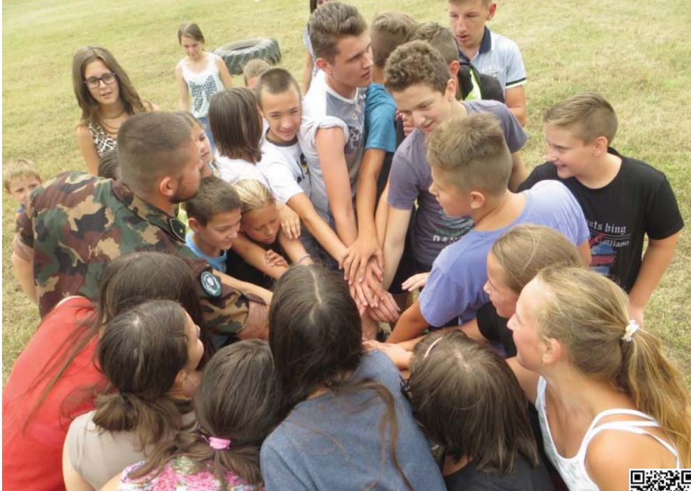
A gyerekek közös csapatversenyen vettek részt a XII. Arrabona Légvédelmi Rakétaezred győri laktanyájában.