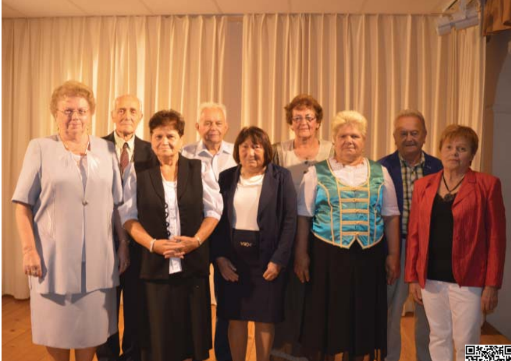
Az idei verseny jubileumi verseny volt, hiszen 10. alkalommal rendezett a Szigetgyöngye Nyugdíjas Klub anekdota- és mesemondó versenyt.