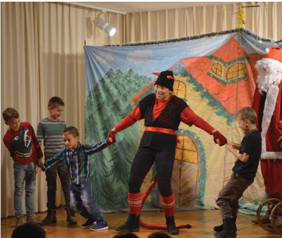
A Hold Színház ezúttal a Mikulást hozta el a kunszigeti gyerekeknek. December 6-án délután a kultúrházban a Győri Nemzeti Színház művészei a Mikulás Família című színdarabot mutatták be, amelyet sok kunszigeti kisgyermek várt izgatottan. Az interaktív előadás nagyon tetszett a kis nézőknek, akiket az előadás után a Mikulás szaloncukorral is megajándékozott.

Áldott karácsonyt és sikeres új esztendő! Kívánok Önöknek, a községünkben elszármazottaknak, valamint testvértelepülésünknek, Nyárádgálfalvának és térségének, továbbá a szomszédos települések önkormányzatainak, és lakosainak.