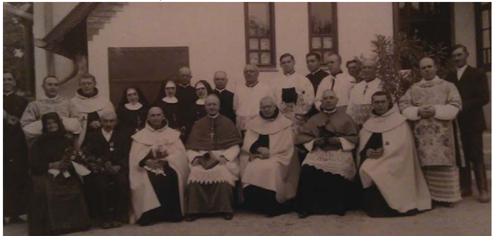
A kevés családi képek egyike, amely 1938 körül készült.