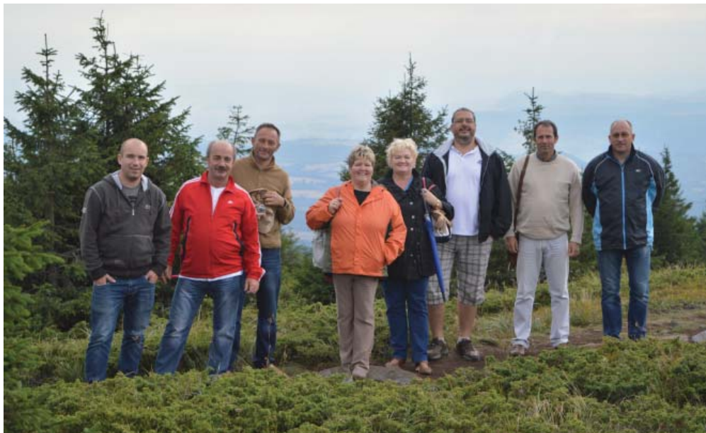
A csoport egy része a Madarasi-Hargitán.

Nyáron az iskolák közötti kapcsolat is foly-tatódott, erről szóló cikkünket a 7. oldalon olvashatják.