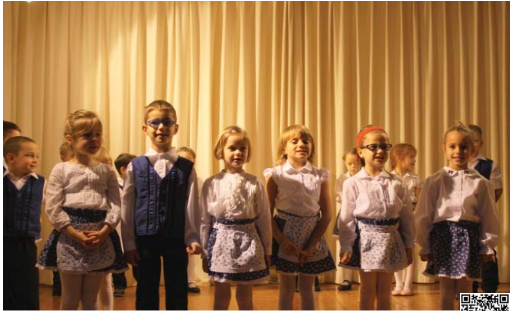
A Tündérvár Óvoda középső csoportos óvodásai is köszöntötték novemberben az időseket az ünnepségen.