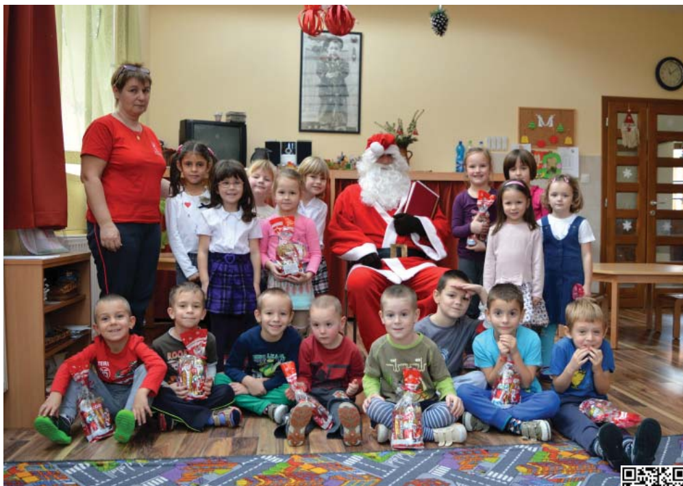
A Mikulás a nagy-középső csoportosnál is járt, a gyermekek versekkel, dalokkal köszöntötték. Minden kisgyermek kapott tőle ajándékot.

Október 30-án "Óvodás Olimpiát" szerveztünk, hét település óvodásait hív-