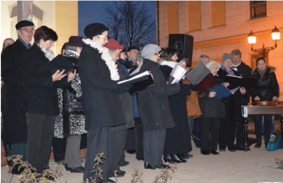
A Szigetgyöngye Nyugdíjas Klub énekkara adventi énekeket énekelt az adventi gyertyagyújtási ünnepségen.