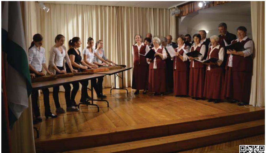
Az idei Itthon vagy - Magyarország szeretlek és Szüreti nap rendezvényén a Szigetgyöngye Nyugdíjas Klub a mosonszentmiklósi citerásokkal adott közös műsort.