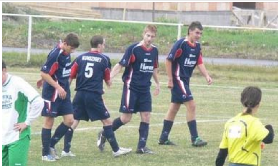
Győrújfalut alaposan meglepte U21-es csapatunk. - További képek: kunsziget.hu