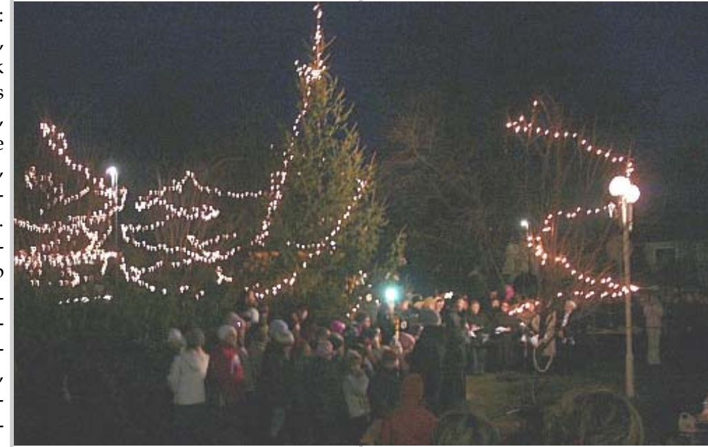
Advent első vasárnapján ismét kigyúltak az ünnepvárás fényei Kunszigeten. A Kossuth téren felállított betlehem és a díszbe öltözött fenyőfák mellett hangulatos ünnepséget rendeztünk, melyet adventi vásár követett.

Hát ezért hívom embertestvéreimet „fényterápiára”: hajnali misére,