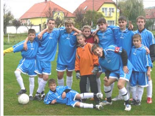
Serdülők: az újjáalakult csapatunk eddig egyszer tudott csak nyerni.

A Kunsziget 11 pontjával a 14. helyen áll. Jobb helyzetkihasználás kellene ahhoz, hogy feljebb léphessünk a tabellán.