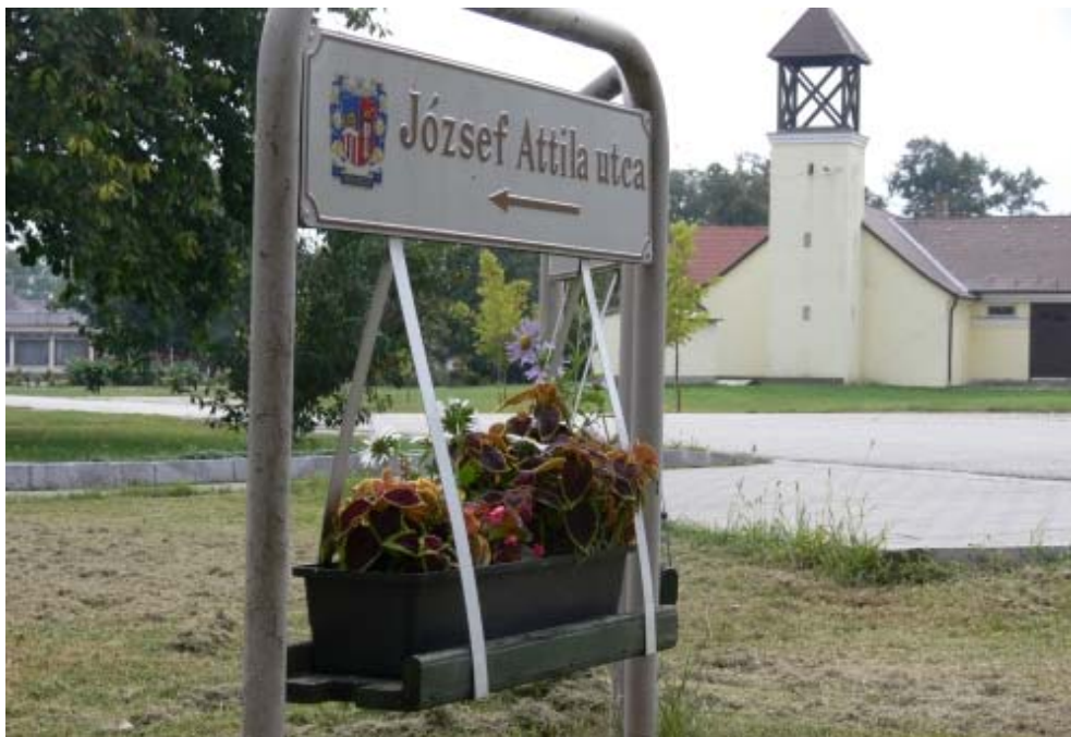
Az utcaneveket jelző táblák alatti virágládákba virágokat ültettünk.

Kunsziget község területén több helyen tapasztalható, hogy a járdákra benyúló faágak, a járdák melletti növényzet elterjedése, szétterjedése miatt lehetetlen a gyalogosközleke-