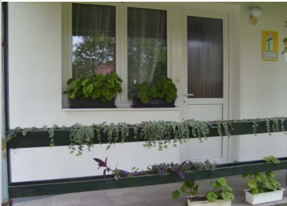
Új bejárattal gazdagodott az óvoda.