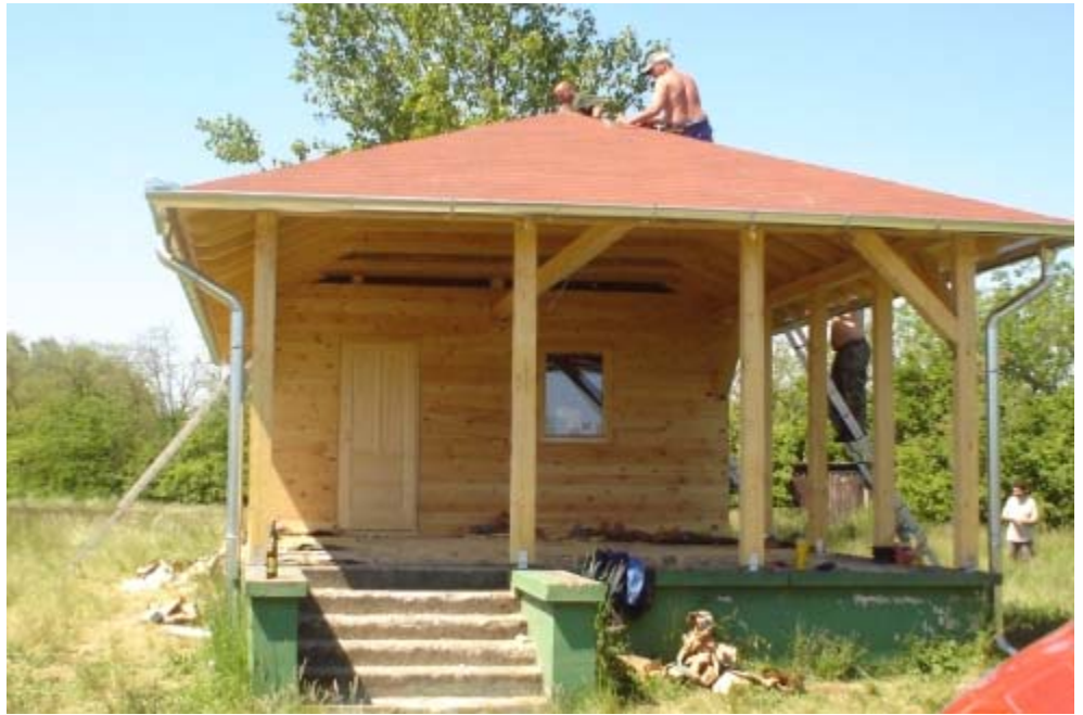
Épül a tanyaház a csiszlói bányatón .