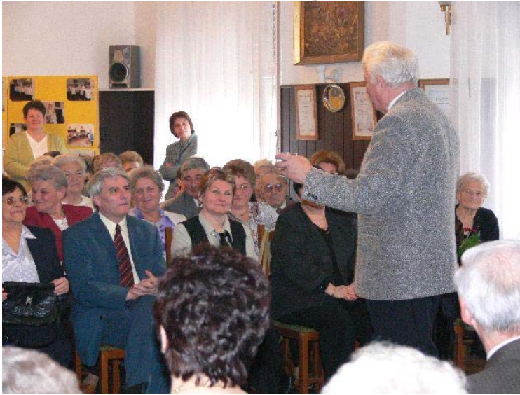
Zenés műsorral zárult a köszöntők sora a február 24-i ünnepen, ahol az elmúlt 15 év emlékeiből kiállítást is készítettek a Nyugdíjas Klub tagjai.

A fenti beszéd elhangzott a február 24-én rendezett ünnepségen. A 15 éves jubileum alkalmából rendezett kiállítás még március közepéig megtekinthető a Kultúrházban.