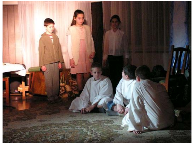
December 22-én az iskolások karácsonyi műsorán készültek a képek, ahol a gyerekek verssel, énekkel és színdarabbal várták a karácsonyt.