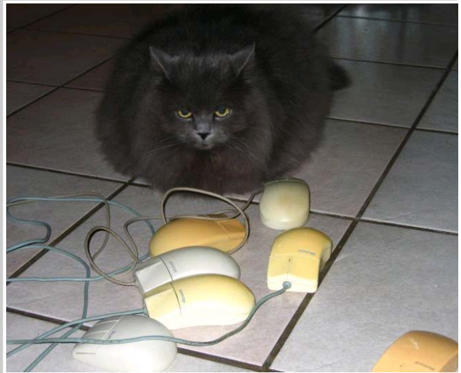
Ha a macska lusta, elszaporodnak az egerek...