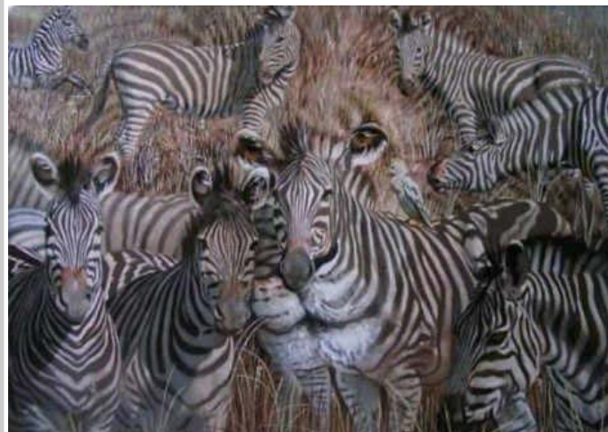
Ellenségek egy képen