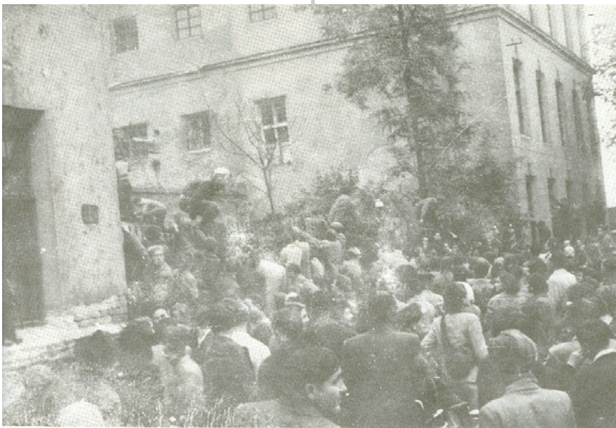
Tüntetés Győrben a Börtönnél október 25-én

Az emberek délelőtt kb. 11 óra tájban a templom előtt