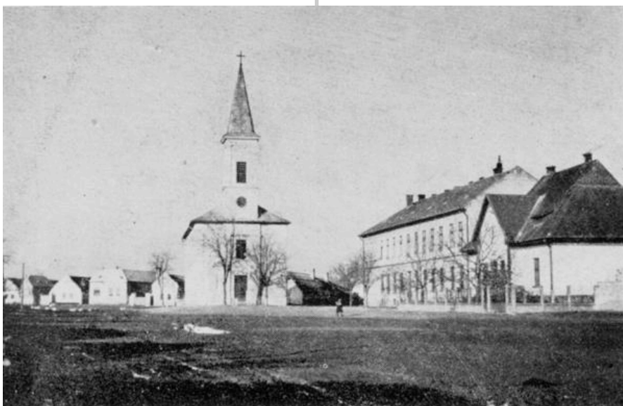
Kunsziget központja az 1940-es évek végén

Magyarország története - településeinek történetéből tevődik össze, amelybe szervesen illeszkedik