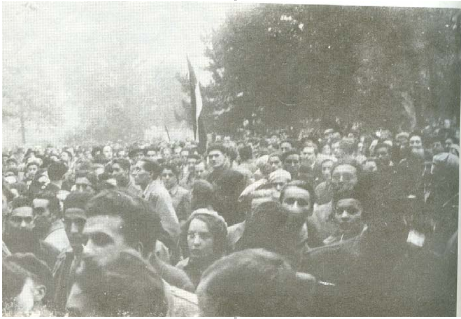
Tüntetés Győrben október 26-án