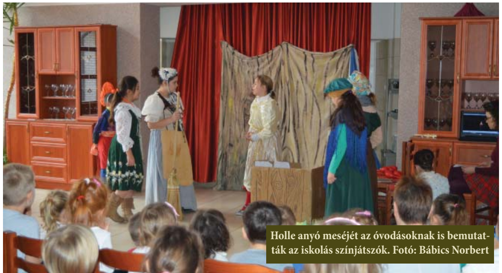
Holle anyó meséjét az óvodásoknak is bemutatták az iskolás színjátszók.