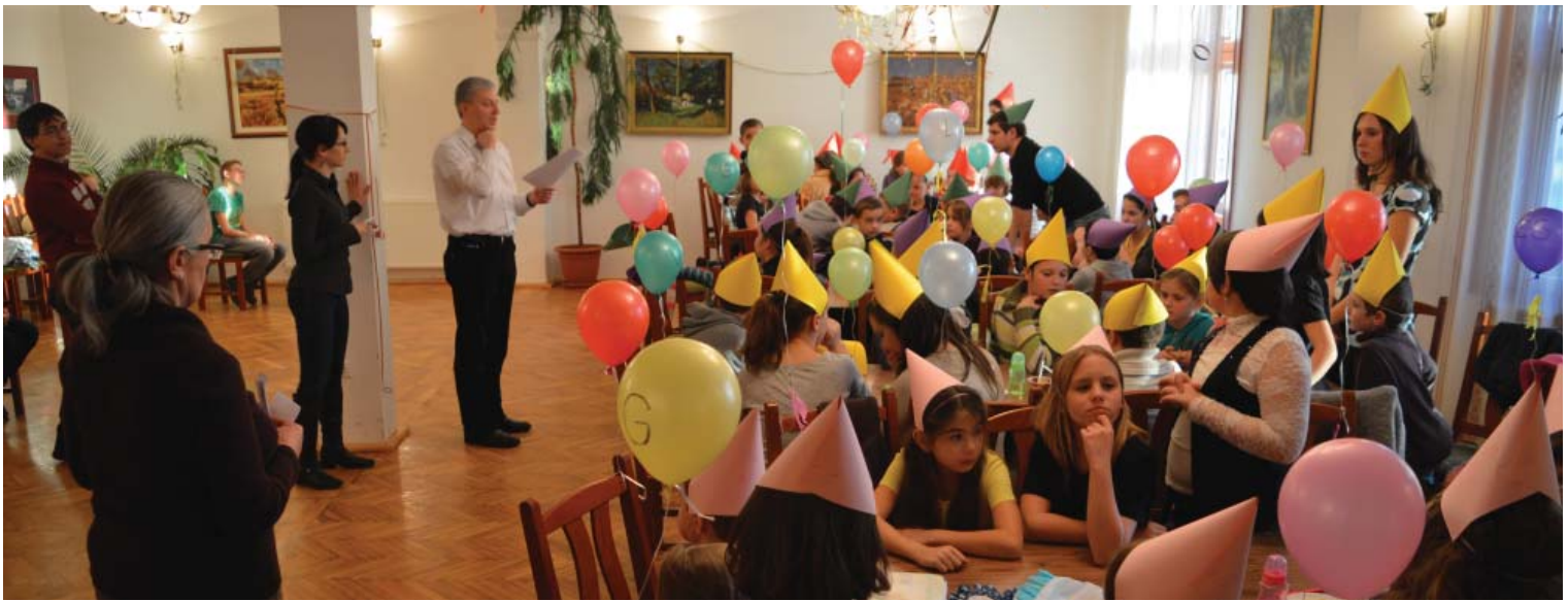
Hagyományos hittanos farsangot rendeztek három falu, Kunsziget, Mosonszentmiklós és Öttevény hittanos gyermekei és fiataljai számára a kunszigeti kultúrházban február 8-án. A jó hangulatú délutánra megtelt a nagyterem.