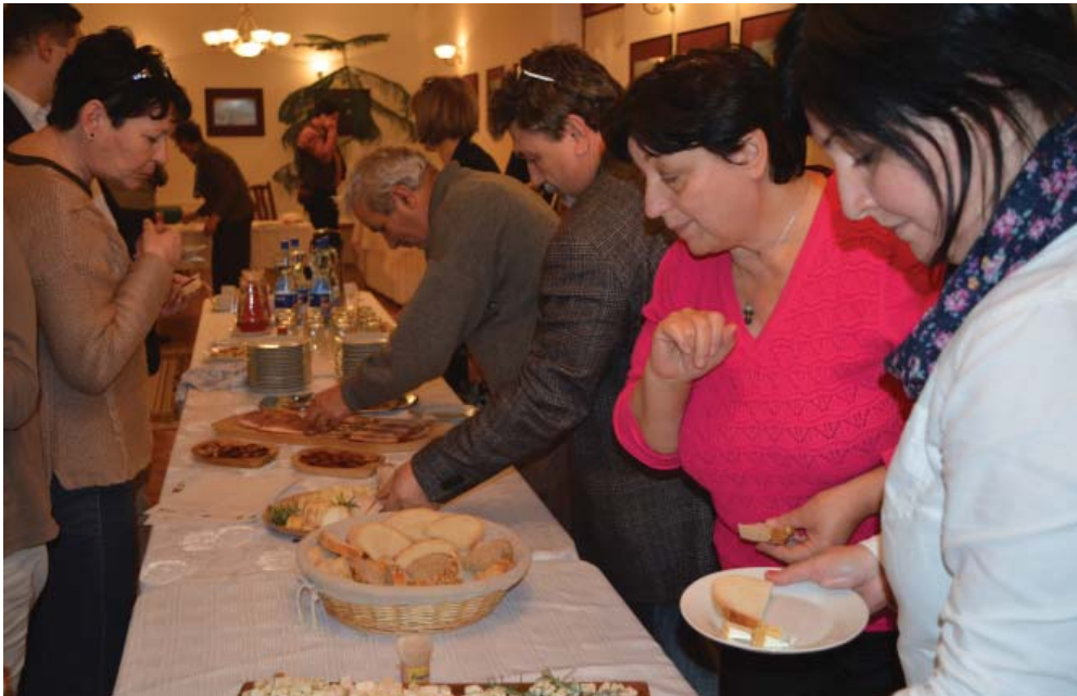
A Múlttal a jövőért című pályázat keretében a térség termelői szakmai délutánon mutatkoztak be a kunszigeti kultúrházban január 13-án.