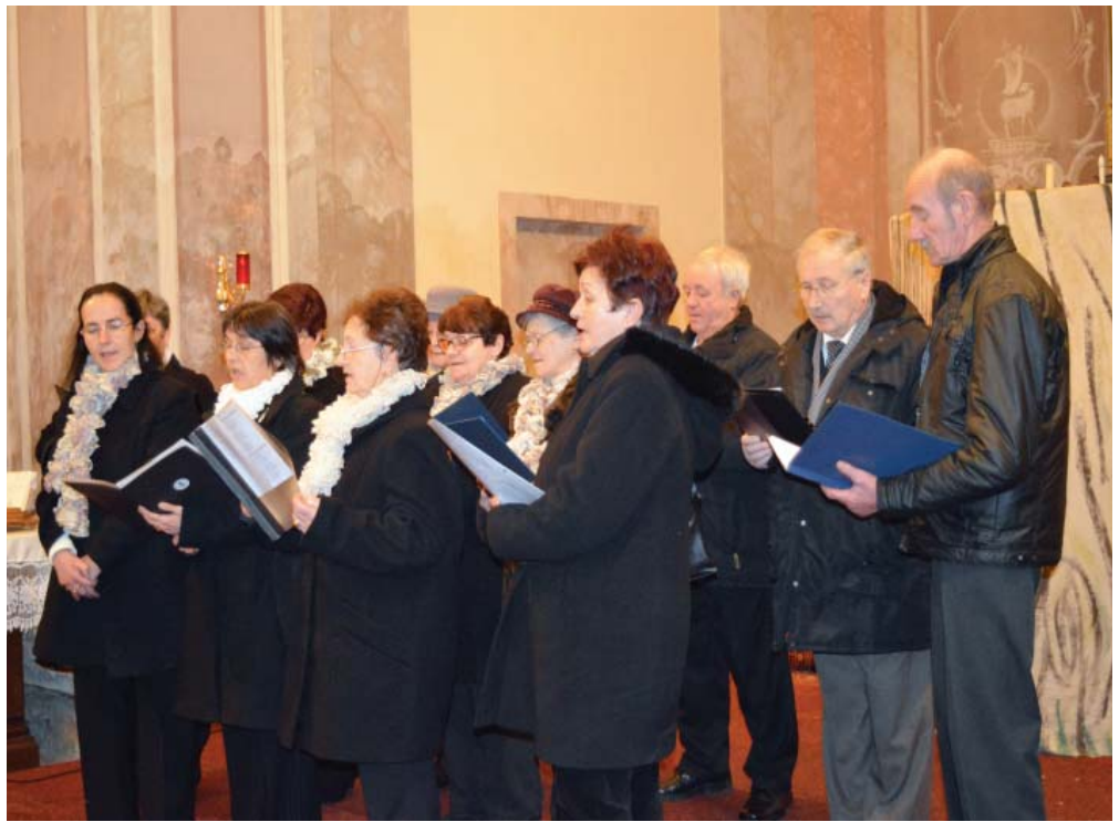
Az énekkar a karácsonyi ünnepségen a templomban is fellépett.

Ötveny, focipálya mellett - nyitva kedd 10-16, szombat 12:30-16 óráig