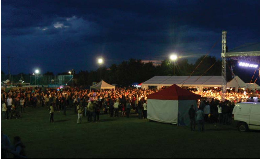
Megtelt a sportpálya a II. Kunszigeti Petrezsirom- és Húslevesfesztiválra.