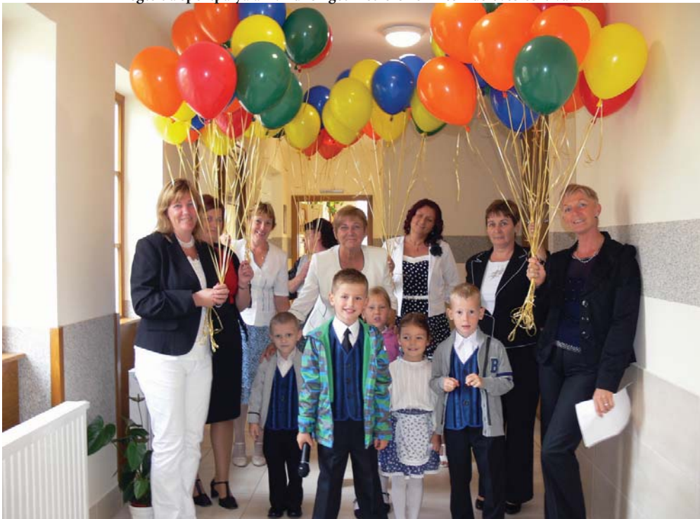
Átadták az új, három foglalkoztatós Tündérvár Óvodát és a 300 adagos főzőkonyhát.