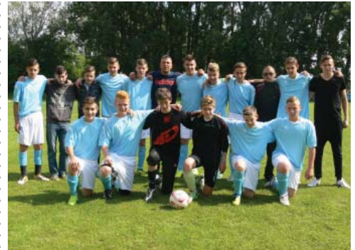
Ezüstérmes lett a Kunsziget SE U16-os csapata.