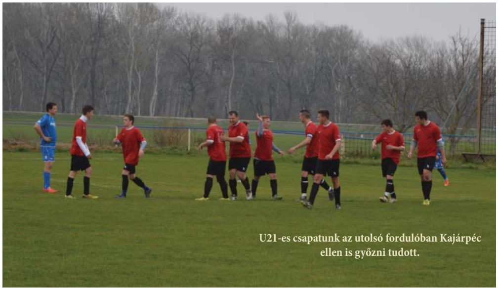
U21-es csapatunk az utolsó fordulóban Kajárpéc ellen is győzni tudott.