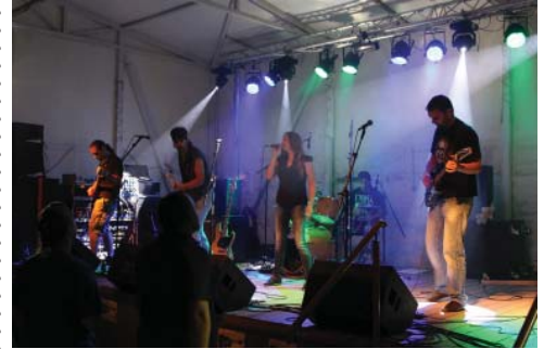
Ismét volt Rock Cirkusz a sportpályán a nyáron.