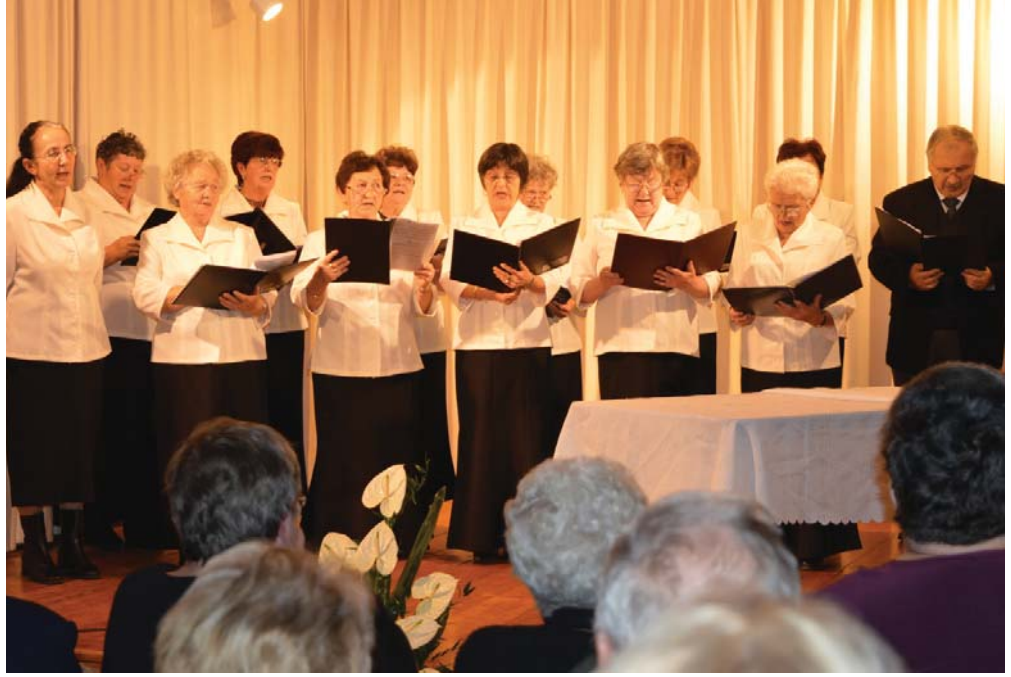
A Szigetgyöngye Nyugdijas Klub énekkara.

16 óra- kor vette kezdetét az „Értük szól...” kulturális est, melyre nagyon sokan jöttek el, mind Kunszigetről, mind a környező településekről. Az esten Szabolcs és lányai is részt vettek mindenki nagy-nagy örömeire. Lendvai