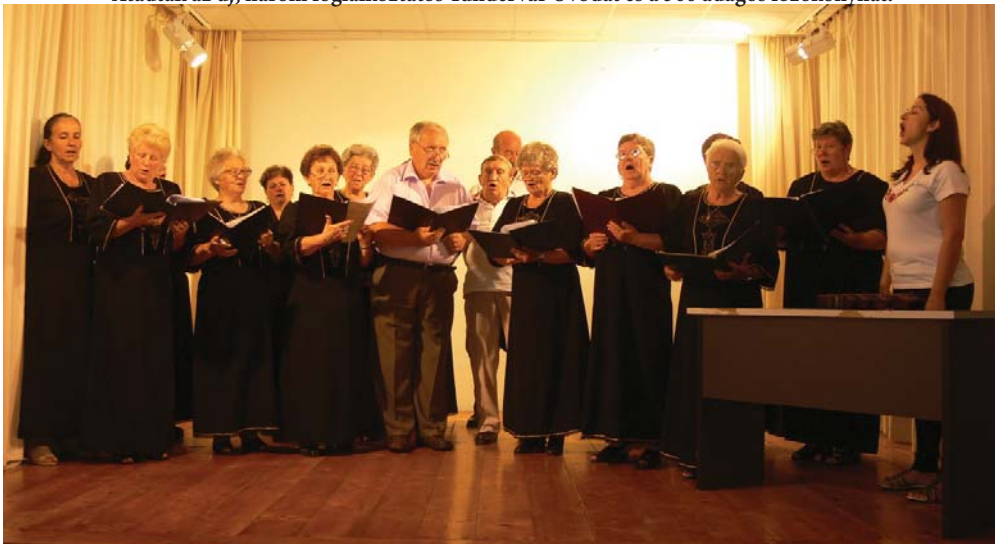
Fennállásának 20. évfordulóját ünnepelte a Szigetgyöngye Nyugdíjas Klub énekkara.