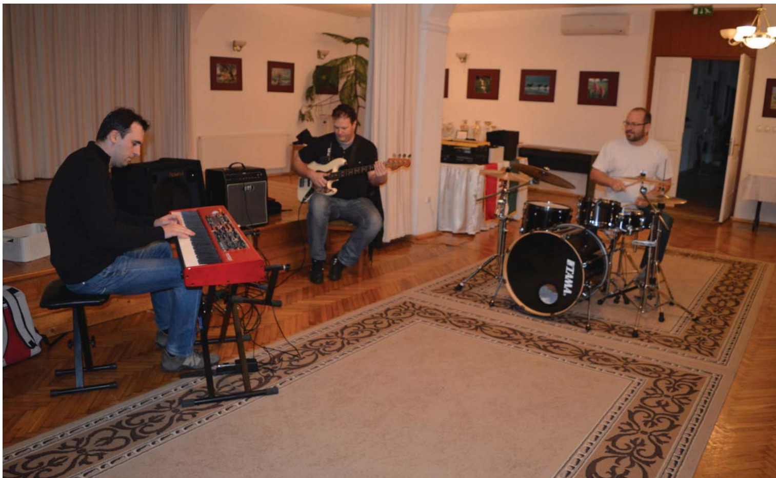
Zenei műhely címmel indított sorozatot az Élő Zenéért Egyesület. A műhelybeszélgetésen bárki részt vehetett, az egyesület a tervek szerint hamarosan folytatni kívánja a programot. Felvételünk a dob és a basszus összhangjáról tartott előadáson készült.