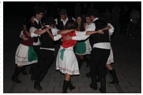
A „Kunsziget, szeretlek” program keretében mutatták be szüreti táncukat a fiatalok.