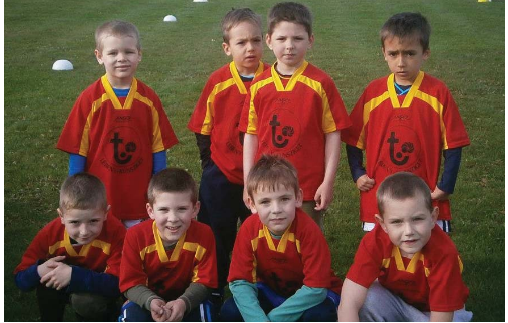
A kunszigeti U7-es futballcsapat magja már óvodás kora óta együtt vesz részt edzéseken heti két alkalommal. Lelkes focistáink szülői és polgármesteri támogatással minden korosztályos tornán, sportrendezvényen megjelennek és rendszeresen az élmezőnyben végeznek.

mérfőzés az életért való nemes küzdelem szimbóluma. (...) A sport a játék alatt tanítja meg az embert rövid idő alatt a legfontosabb polgári erényekre: az összetartásra, az önfeláldozásra, az egyéni érdek teljes alárendelésére, a kitartásra, a tettekrekeszségre, a gyors elhatározásra, az önálló megítélésre, az abszolút tisztességre, és mindenekelőtt a "fair play", a nemes küzdelem szabályaira.”