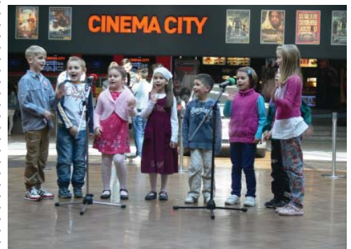
A Győr Plazában mutatkoztak be a kunszigeti iskolások.