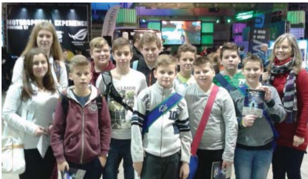
Az iskolások egy csoportja a Play-IT kiállításon, Budapesten.

December 19-én, pénteken 15 órától a Kunszigeti Templomban lesz iskolánk karácsonyi ünnepsége, amelyre ezúton szeretettel meghívjuk Önöket.