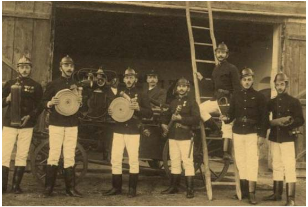
Kunszigeti tűzoltók az 1900-as évek elején.

A pályázatok egyik feltétele az együttműködési megállapodás, amit a győri hivatásos