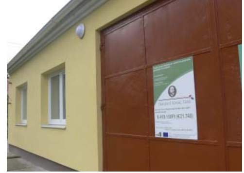
Néhány kép az ideai fejlesztésekről: napkollektor a sportcsarnokon, leaszfaltozták a Szent István Király utcát, felújították a tűzoltószertárt.