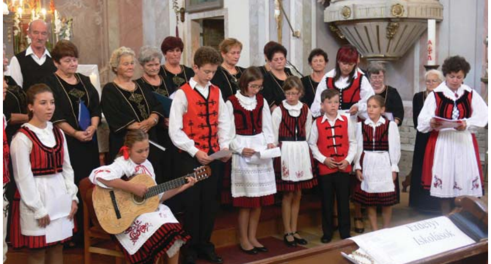
Erdélyi gyerekek és tanáraik az augusztus 20-i kunszigeti ünnepélyen.

Falunk megismerése után vendégeink elismerően nyilatkoztak közös munkánkról, melyet az elmúlt két évben valósítottunk meg. Jártunk Majkpusztán, Tatán, Komárnóban, szűkebb térségünkben, Lébényben,