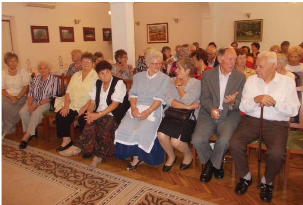
Nyolc településről érkeztek Kunszigetre anekdotázó és mesemondó idősök.

A szervezését, a lebonyolítást, vendégeink részére a sok finom sütemény sütését a Szigetgyöngye Nyugdíjas Klub tagjai végezték - mindnyájukat köszönet illeti érte.