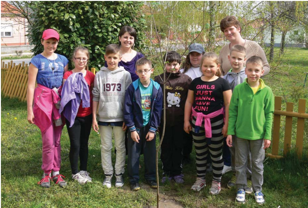
Az iskolások emlékfákat ültettek a kápolna mellett, hogy azokat iskolás éveik alatt folyamatosan gondozzák. Képiünkön a harmadik osztályosok egy csoportja tanítóikkal.