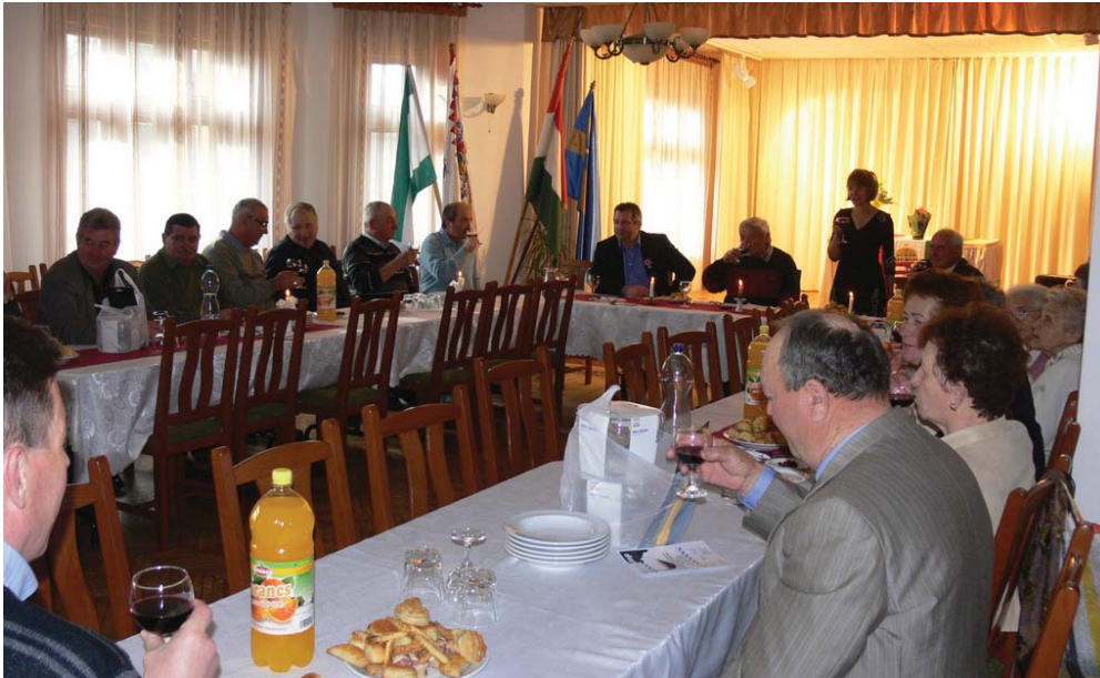
Márciusban rendezte hagyományos borversenyét a Kunszigeti Faluszépitő Egyesület. A hagyományokhoz híven pogácsasütő versennyel egybekötve.