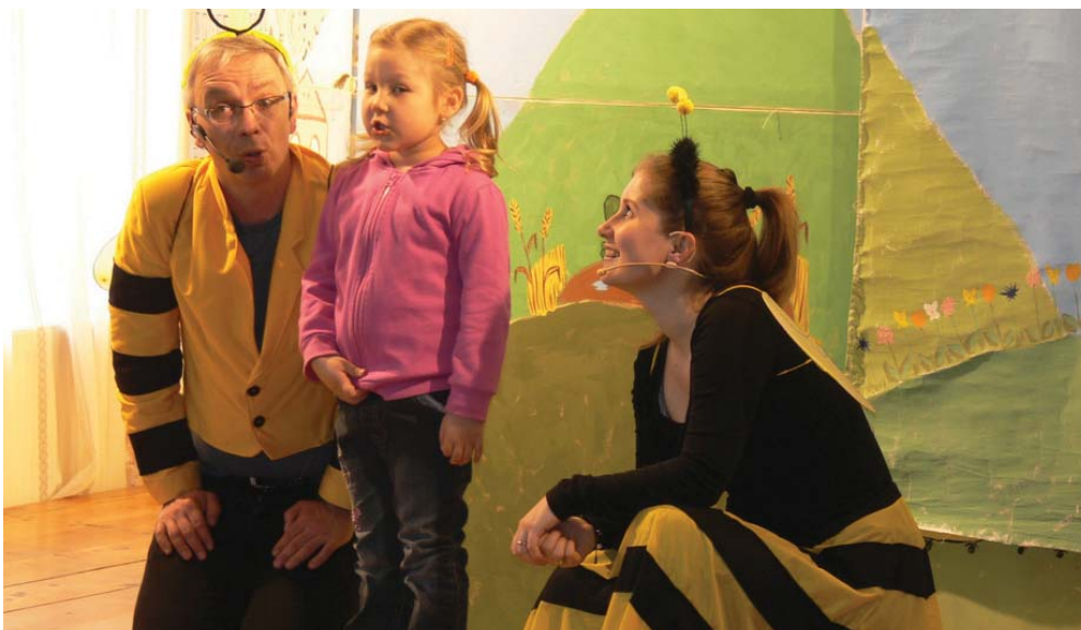
A debreceni Léghajó Színház előadása az óvodásoknak az IKSZT-ben.