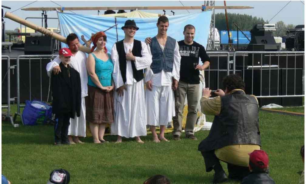
Pillantkép a Kajárpéci Vízirevüé előadásából.