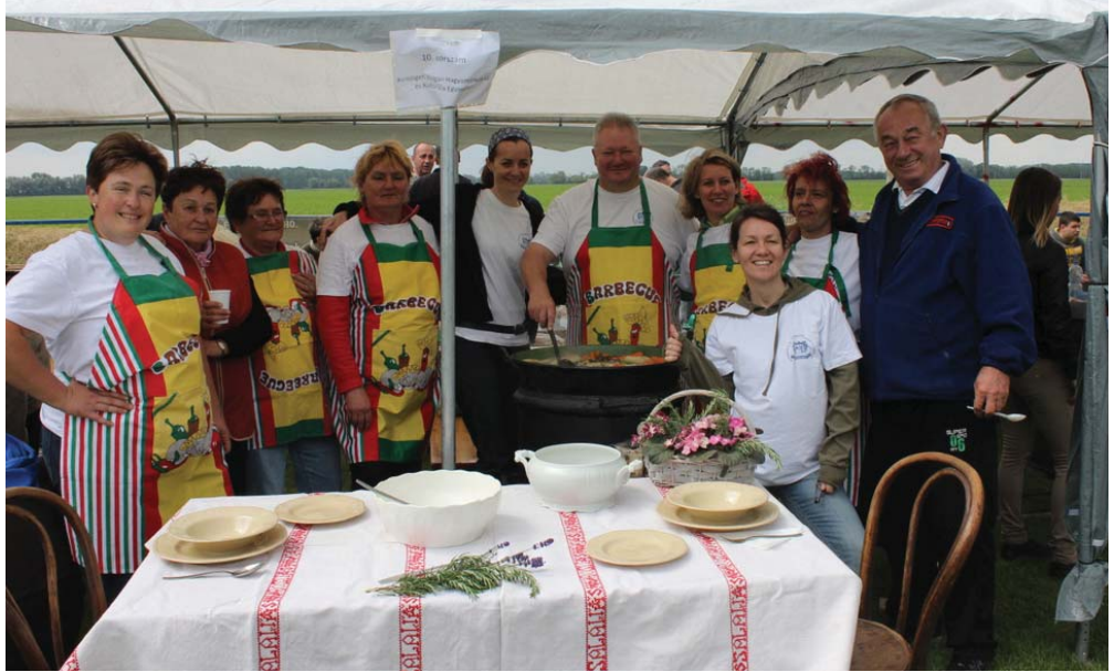
A legháziasabb leves díját a Kunszigeti Polgári Hagyományörző és Kulturális Egyesület kapta.

A remek hangulat megmaradt az éjszaka hátralevő részére is, erre a Grammy együttes neve jelentett garanciát. A fesztivál méltó zárása volt a zenekar éjszakába nyúló koncertje..