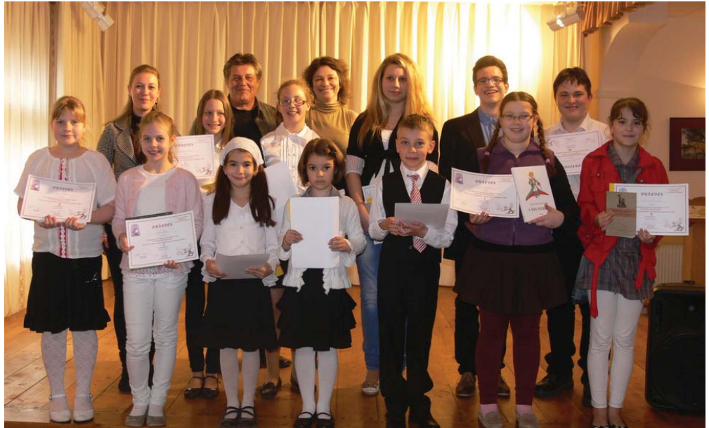
A versmondó verseny kategóriáinak helyezettjei és a zsűri.