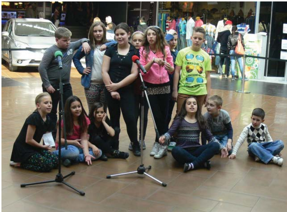
A színjátszó tanszak tanulói, a Kunszigeti Gézengúzok a Győr Plazában.

Május 9. és 11. között került megrendezésre 24. alkalommal Mosonmagyaróváron a „Kárpát-medencei amatőr színjátszók találkozója”. A 21 kiválasztott bemutató között lehetett a Kunszigeti Gézengúzok előadása, Janikovszky