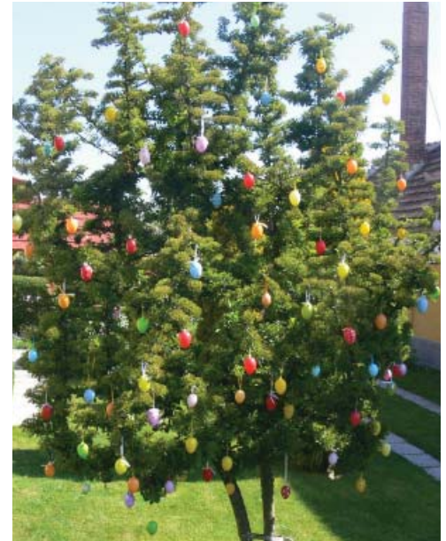
Vitéz Péterék húsvéti tojásfája