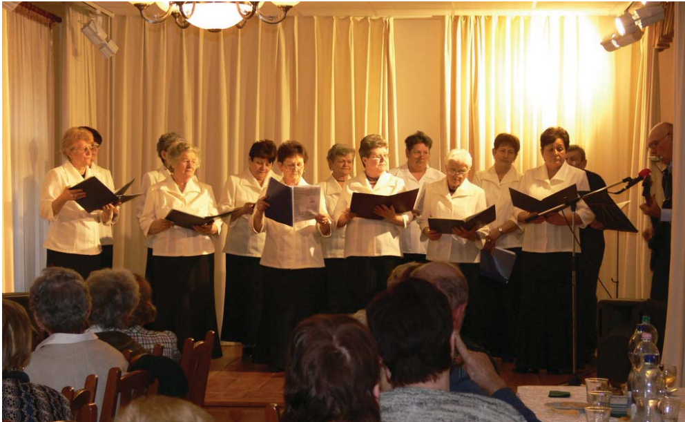
A Szigetgyöngye Nyugdijas Klub a lébényi nyugdíjasok egyesületével közösen tartotta farsangi klubdelutánján, ahol a lébényiek táncol, a kunszigeti nyugdíjasok pedig dalsokkal adták meg az alaphangot a jó hangulatú beszélgetéshez.