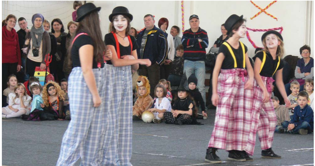
A február 15-i farsangi bál csúcspontja a keringő volt, ahol a nyolcadik osztályosok szüleikkel táncoltak.

A legügyesebb tanulóink képviselték isko-