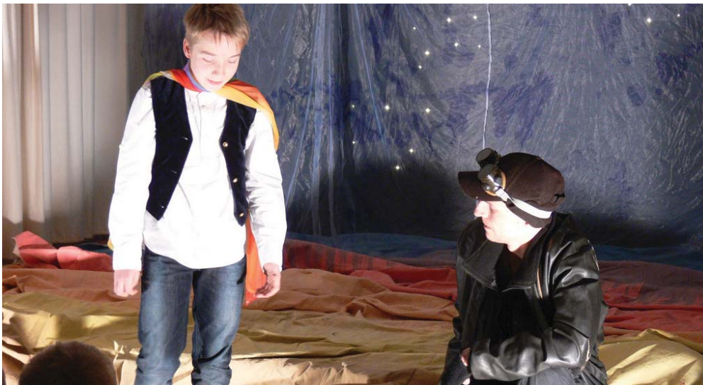
A Hold Színház előadásában látható a közel száz érdeklődő - főként kisgyerek - A kis herceg című zenés mesét a kultúrházban decemberben.