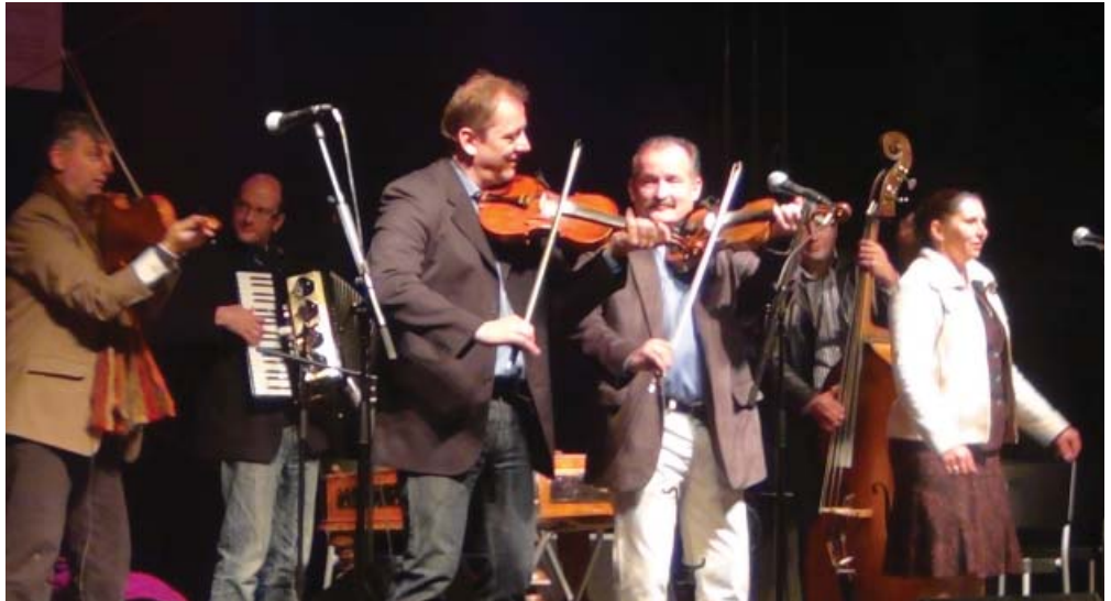
A Csík Zenekar koncertje ezeket vonzott Kunszigetre.

A nap folyamán több régi mesterség is megelenedett a plébánia udvarán: kosárfonás és csuhéfonás mellett a XIX. század elejéről származó kemencében is újra langalló készül. Régi ételeket lehetett kóstolni, sőt megválasztották Kunsziget legfinomabb lekvárját is.