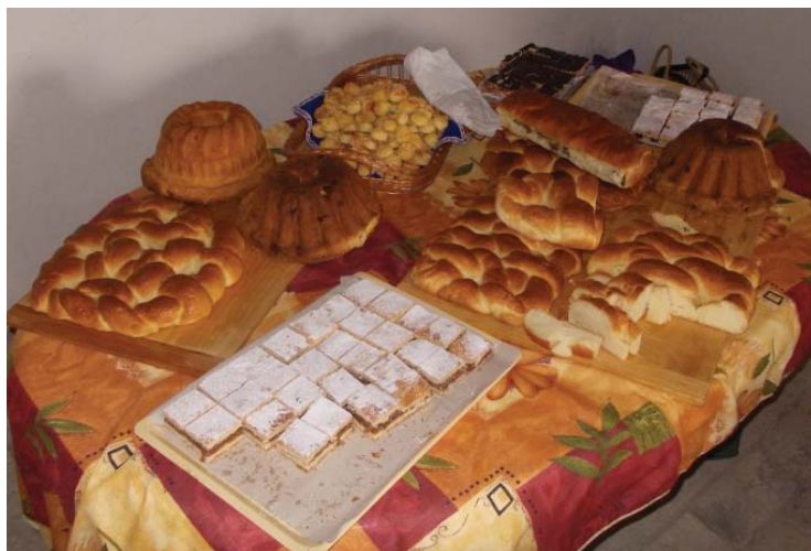
A fenti képek az I. Kunszigeti Húsvéles- és Petrezsiromfesztyiválon készültek. A fesztiválról lapunk 5. oldalán olvashatnak. További képeket találnak a kunsziget.hu honlapon, valamint a facebook.com/kunsziget oldalon.

Az idei adventi gyertyagyűjtásra és az azt követő vásárra sokan látogattak el. Az eseményről lapunk 1. és 2. oldalán olvashatnak. Képünk a Kossuth téri helyi piaci pavilonok előtt készült (írás a helyi piacról a 7. oldalon).