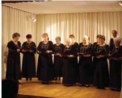
A nyugdíjas klub énekkara számos rendezvényen részt vett a második félévben is. Képünkön az október 23-i ünnepély.

Két alkalommal vettünk részt az Életet az Éveknek megyei klubszövetség megyei szintű rendezvényén: Lébényben október 9-én a megzenésített versek „Olyan a dal, hogy a bú hozza, kedv hordozza” és október 20-án Öttevényen a „Magyar kultúra” jegyében - címmel. Mindkét településen nagyon igényes, jól szervezett találkozón vettünk részt. A nyugdíjas klubok tagjai igyekeztek színvo-