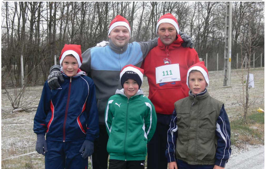
Mikulás-futást rendezett 2 és 5 kilométeres távokon a Federal Mogul Hungary Kft. december 8-án, szombaton. A zord hideg ellenére sokan indultak a versenyen, ahol nemcsak a cég dolgozói vettek részt, hiszen az mindenki számára nyitott volt. Képpünkön a rövidebbik táv leggyorsabb versenyzői.

A csapatnak már saját meze és labdái is vannak, hiszen az októberi fesztiválon a Lurkók csapata részére gyűjtöttek a szülők. A támogatást ezúton is köszönik mindenkinek.