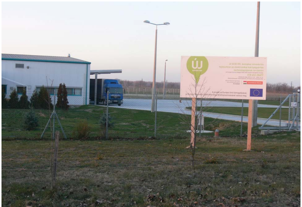
A SICK kunszigeti üzemének bővítése, s vele az elektronikai kártyagyártás modernizációja a munkahelyek számának növekedését is előrevetíti és a cég forgalma is növekedhet.

A jelenlegi 298 főnyi létszámot 2017-re 419-re emelik, eközben 80-ról 75 százalékra csökkentve a fizikai dolgozók arányát.