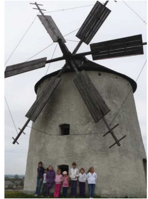
A tési fennsík nevezetességeit, a szélmalomokat is megnéztük kirándulásunk során.

tett az utunk. A kiállítás végigkalauzolt bennünket a távcső történetén. Nagyon sok érdekességet tudhattunk meg a Holdraszállásról és a Mars kutatásáról is. Idősnek és fiatalnak egyaránt nagy élményt nyújtott a XXI. század technikájával működő digitális planetárium,