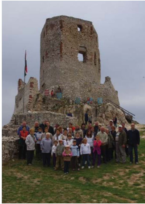
A csoportkép a sziklaormon álló cseszneki várnál készült.

Délután azt követően, hogy megnéztük a Bakonyi Erdők Házát és a Néprajzi Múzeumot is, a nemrég épült Pannon Csillagdába ve-