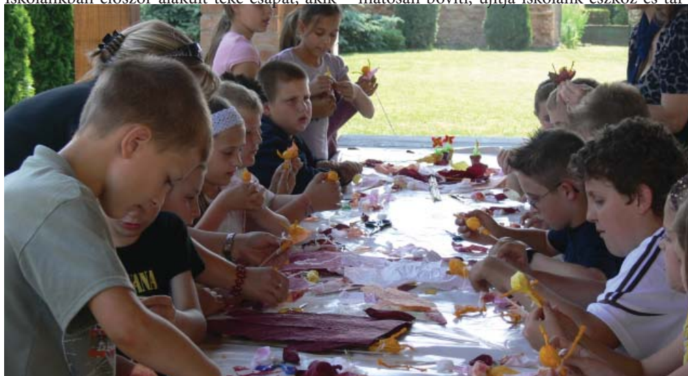
Kézműves foglalkozás az iskola által szervezett családi napon.

Köszönöm a bizalmukat és remélem, minél több asszonynak segíthetek.