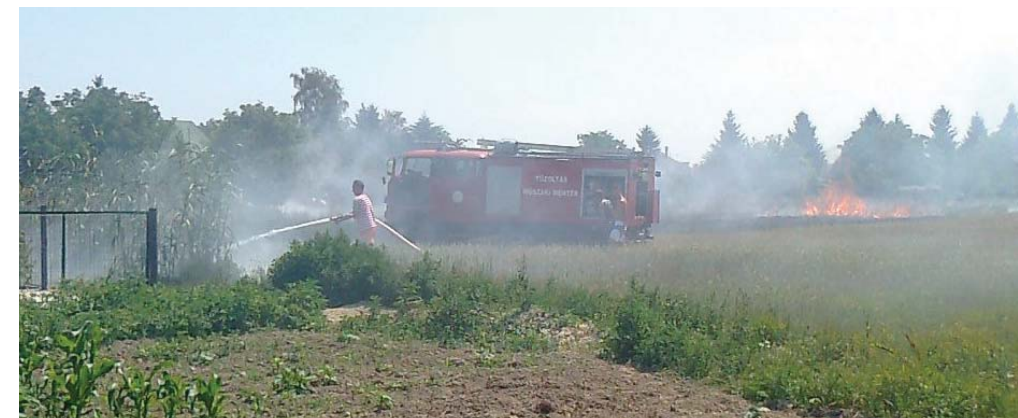
Kunszigeten, a Kertes utcában száraz fű és avar kapott lángra: a kunszigeti önkéntes tűzoltók oltották el a tüzet.