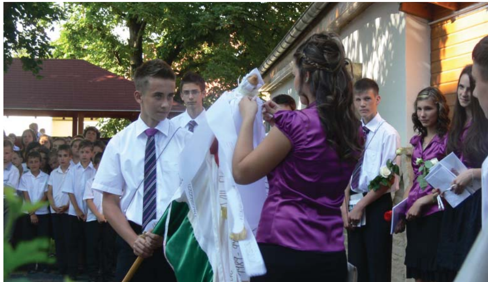
A nyolcadik osztályosok a ballagási ünnepség részeként felkötötték szalagjukat az iskola zászlajára és átadták a zászlót a hetedikeseeknek.

Büszkék vagyunk azokra a diákjainkra, akik a szorgalmas tanulás mellett versenyre készültek tanáraikkal és vitték iskolánk hírnevét a szomszédos iskoláktól kezdve a megyehatárokra túlra. Számos körzeti tanulmányi és sport versenyen vettünk részt. Összemértük tudásunkat Győrzámolyon versmondásban, Győrladaméron matematika-logika és anyanyelvversenyen voltunk, majd Kisbajcon természetismeret területen jeleskedtünk. Lébényben mesevetélkedőn szerepeltek kiválóan tanulóink. Számos levelező versenyre neveztek, ahol szintén jó eredmények születtek. Küzdöttünk a Tilai kupán és a Rigó Béla labdarúgótornán és több kézilabda és focimérkőzéseken. Összemértük tudásunkat a városi elsősegélynyújtó versenyen, ahol az induló csapatokat magunk állítottuk. Iskolánkban először alakult teke csapat, akik