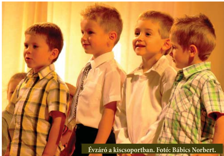
Évzáró a kiscsoportban.