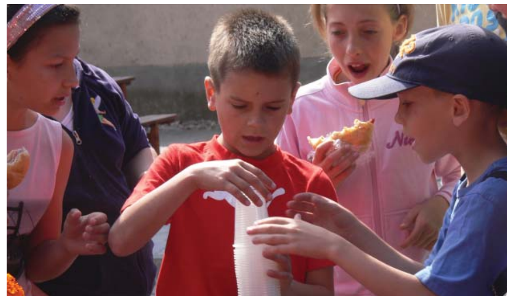
Családi napot és gyermeknapot rendezett Kunsziget Község Önkormányzata és a Kunszigeti Két Tannyelvű Általános Iskola június 15-én a sportpályán. A délutánon a gyermekek szüleikkel, nagyszüleikkel közösen vettek részt különféle játékokban és a Ki mit tud? versenyben.