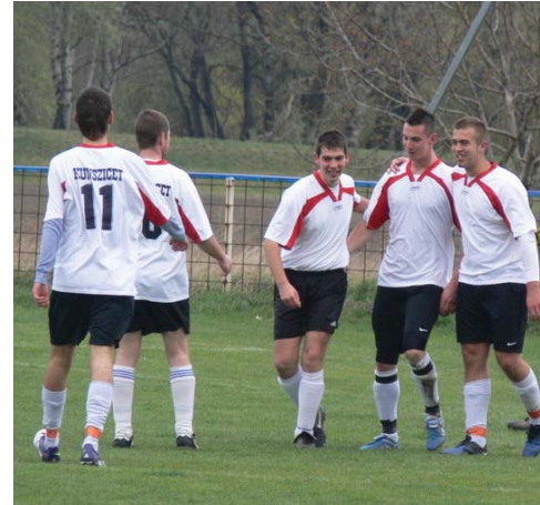
Gólöröm Dunasziget ellen a hét kunszigeti gól egyike után.

A tartalékok ugyan remekül zárták az őszt, tavasszal azonban kikapnak Ásványrárótól, és egy több szempontból is szerencsétlenül alakult meccsen Mecserőtől is, döntetlent játszottak Halászival és Károlyházával - a Dunasziget, a MITE és a Levél elleni győzelem azonban kevés volt még az ezüstérem megtartásához is. Az eredmények romlásához nagyban hozzájárult, hogy többször tartalékosan (vagy kevés rutinnal rendelkező játékosokkal) állt ki a csapat, ráadásul az ősszel remeklő csapatból tavaszra három kulcsember is hiányzott.