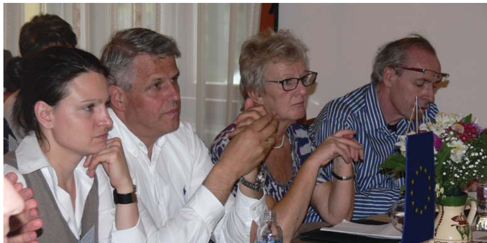
A négytagú zsűri a kultúrházban tartott prezentáció hallgatása közben.

Kunziget harmadik alkalommal vesz részt (2007, 2009, 2011) a Magyarországi Falumegújítási Díj című pályázaton, ahol mindhárom alkalommal kiváló helyezést ért el. A díj odaítélésnél bírálta a magyarországi értékelő bizottság a természeti-, épített-, és kulturális örökség őrzését, a gazdasági fejlődést, a szociális ellátottságot, a lakossággal folytatott szoros párbeszédet, a civil szervezetek és a lakosság szerepét a község életében, az előbbieket kölcsönös egymásra hatását. Vizsgálta a településen megvalósított fejlesztések fenntartha-