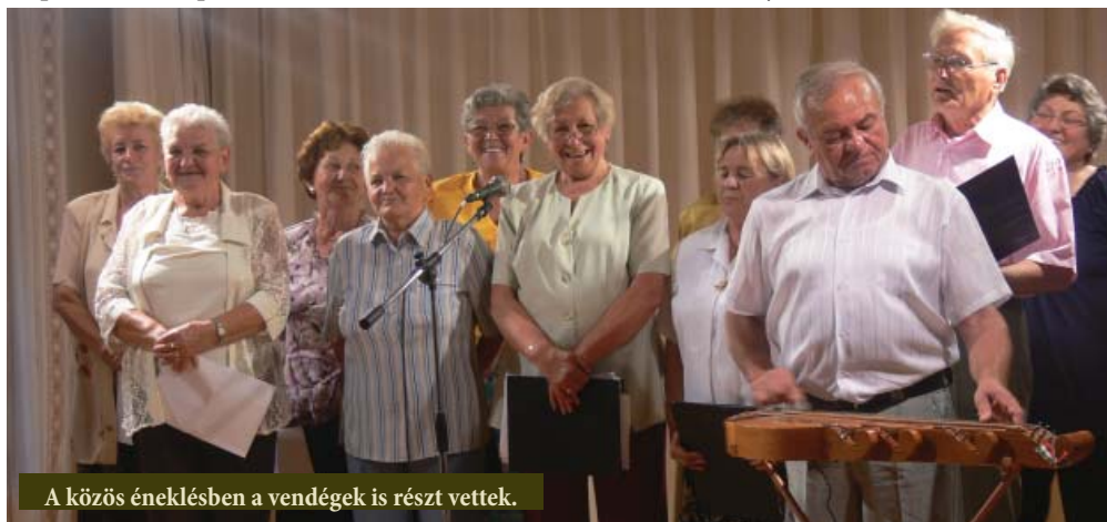
A közös éneklésben a vendégek is részt vettek.