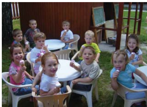
Az ovisok az ajándék fagyival.

Minden óvodai év végén kicsi és nagy gyermek izgatottan készül az évzáróra. Június 1-jén a kiscsoportosok a Kultúrházban adtak izéltető vendégeinknek az egész évben tanultakból. A gyermekek nagyon ügyesen és bátran adták elő szerepeiket, mindenkit nagy-nagy dicséret illet. Sajnos a nagycsoportosok évzáró ballagó műsorának időpontjára az időjárás kedvezőtlenre fordult és nem tudtuk a tervezett külső helyszínen megtartani. A kellemet-