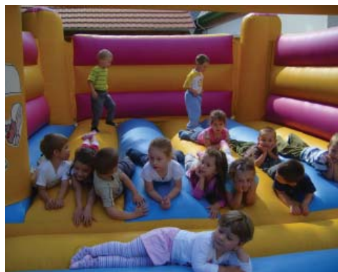
Légvár az ovis gyereknapon.

lenségek ellenére a gyerekek nagyon ügyesen mutatták be produkciójukat, az előadás végén a vendégeket is közös, vidám éneklésre, táncra invitálták. Középsősök elbúcsúztak a „nagyoktól”, hisz szeptemberben már iskolások lesznek, a játék helyett az iskolapad vár rájuk. Az ünnepély zárásaként megható vers-összeállítással búcsúztak az óvoda dolgozóitól a nagycsoportosok. Köszönjük az elkészítő szép szavakat, kívánjuk, hogy iskolába is szeressetek járni és tanuljatok szorgalmasan!