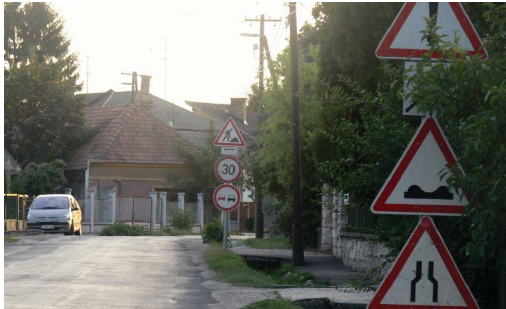
Június végén a figyelmeztető és korlátozó táblák is kikerültek: indulhat a felújítás.

Az Ötvenévről Kunsziget felé tartó bekötőút ezen szakaszának felújítására 144 millió forintot költ EU-s forrásból a magyar állam. Az út állapota erősen leromlott, kátyús, a