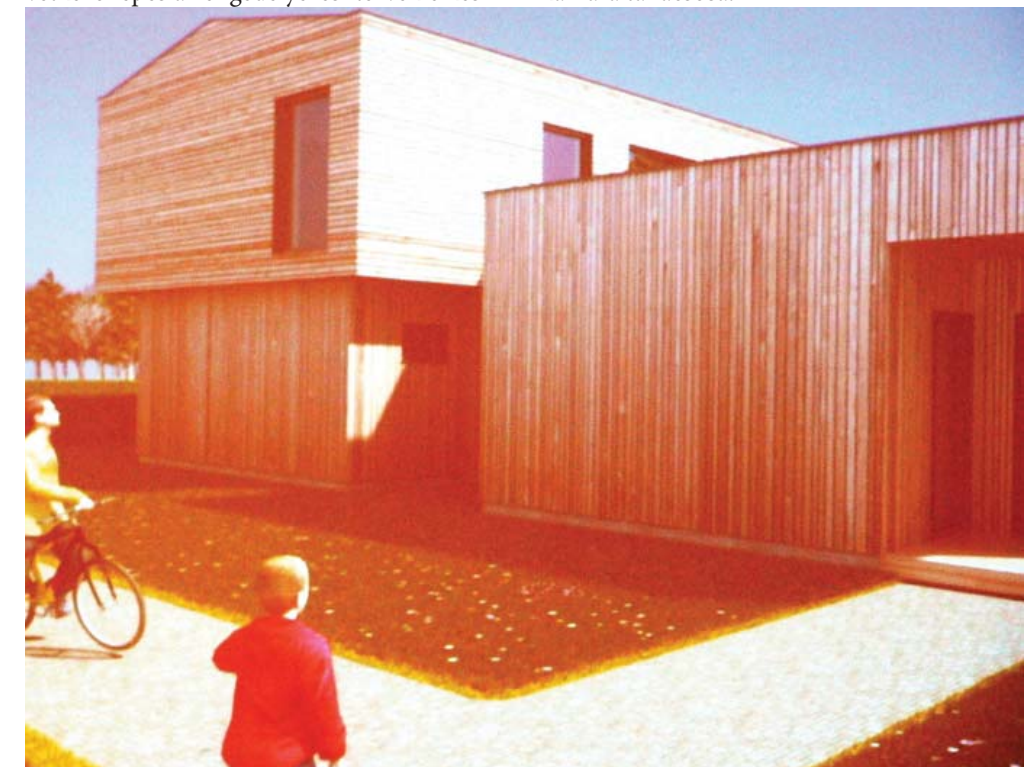
Látványterv az épületről.

Egyesület elnöke elmondta, hogy a környezetvédelem, a környezettudatos élet és gazdálkodás lesz a gyermekközpont fókuszában, de a pénzügyi kultúrára, a vásárlási szokásokra, az öngondoskodásra, az önfenntartó életre nevelésre is nagy hangsúlyt helyeznek.