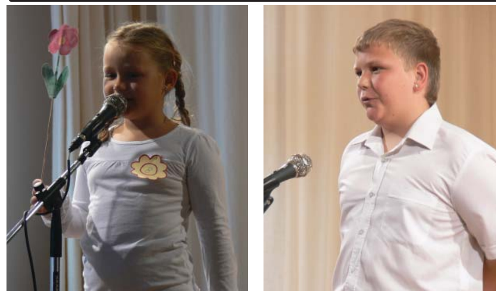
Tavaszköszöntő vers- és prózamondó versenyt rendezett áprilisban a Kunszigeti Két Tannyelvű Általános Iskola. A versenyre ezúttal több környékbeli iskola is meghívást kapott. A két helyszínen zajló verses-próza délutánnak a kultúrház és a könyvtár adott helyet, a résztvevőket pedagógusokból, előadóművészekből álló zsűri rangsorolta. Májusban a Kunszigeti Két Tannyelvű Általános Iskola első alkalommal rendezte meg angol mondókaversenyét első és második osztályosok körében. Öt iskolából 29 versenyző mérte össze tudását a kultúrházban. A képek a versenyeken készültek.