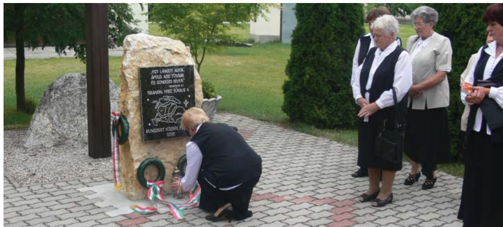
Koszorúzás a trianoni emlékoszlopnál.