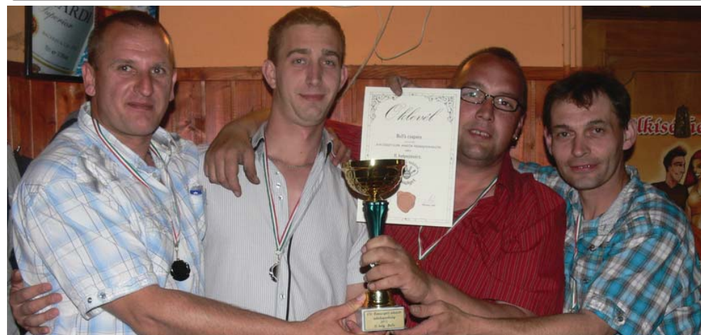
Áprilisban befejeződött az idei amatőr tekebajnokság. Az idei versenysorozat is a címvédő, a Tóth-Transz nyerte, a második az újonnan alakult Bulls lett (képünkön), a harmadik helyezés végül az Öreg golyók csapatáé lett. Remekül szerepeltek a Házisárkányok is, tisztán női csapatként az előkelő negyedik helyet szerezték meg a négy hónapon át tartó küzdelemben.