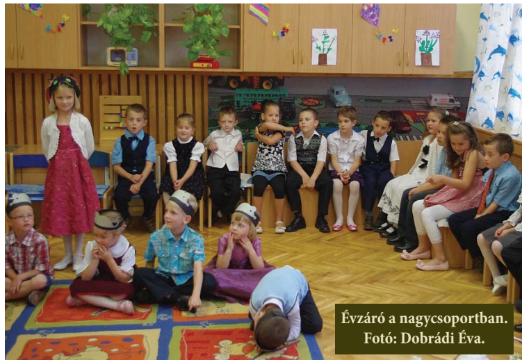
Évzáró a nagycsoportban.