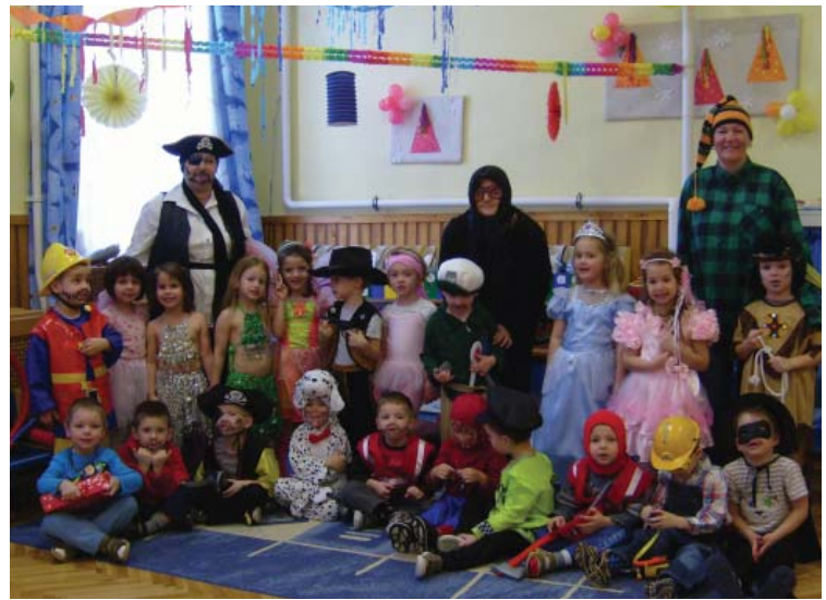
Vidám hangulatban telt a nap február 17-én a hagyományos óvodai farsangi jelmezbálon. A kunszigeti Tündérvár Óvoda apraja nagya jelmezbe bújt ezen a napon.