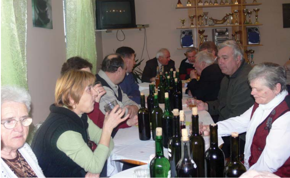
Remek hangulatban telt a 20. Kunszigeti Borverseny és Pogácsasütő verseny.