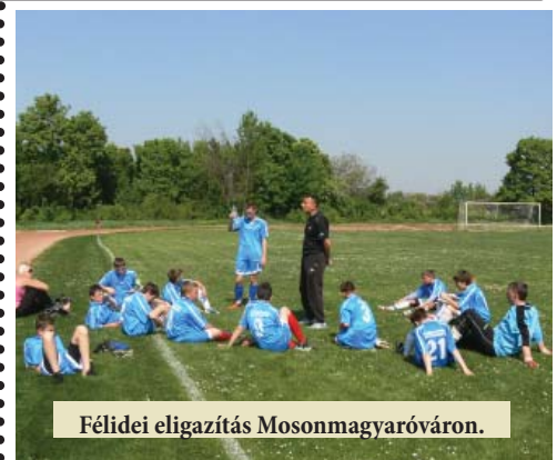
Félidei eligazítás Mosonmagyaróváron.

A bajnokságban így sikerült az őszi végén ötödik helyről a második helyre feljönni. Ez a helyezési már az utolsó mérkőzéstől függetlenül nem változik, hiszen a harmadik helyen álló Újrónafő hátránya hat pont. Pontszámban ugyan utolérhetjük az első helyezett Halászit, de a győzelmek száma miatt meg már nem előzhetjük őket. Ettől függetlenül a tartalékok meccse is igazi presztízmérkőzés lesz vasárnap 15 órától.