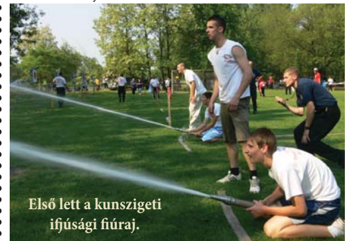
Első lett a kunszigeti ifjúsági fiúraj.

A siker hírért az egyesület szirénázó tűzoltóautójával vitte körbe a faluban.