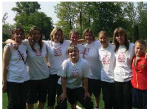
A felnőtt női raj harmadik helyen végzett.

Az ötvenéves tűzoltóversenyen tehát összesen két első, egy második és egy harmadik helyezést szerzett a Kunszigeti Önkéntes Tűzoltó Egyesület, ami az utóbbi évek legjobb eredményének mondható.