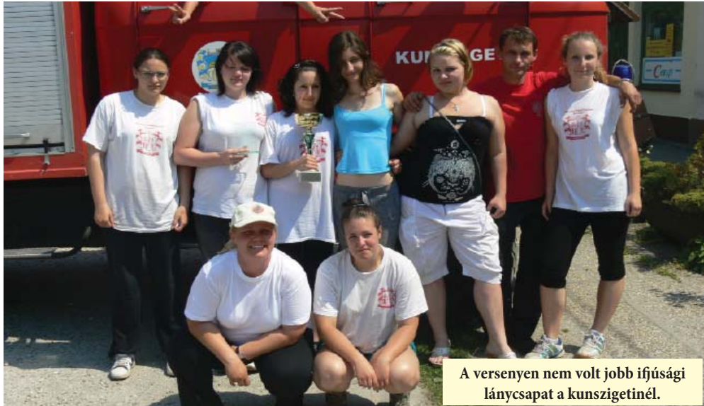
A versenyen nem volt jobb ifjúsági lánycsapat a kunszigetnél.