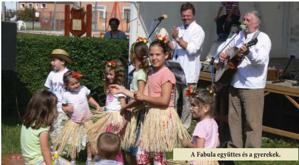
A Fabula együttes és a gyerekek.