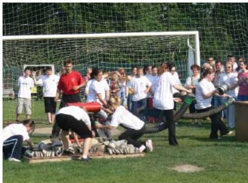
Második helyezést ért a jó szerelés az általános iskolás lányoknál.

Ezután iskolás fiúk próbálkoztak meg a szereléssel. Sajnos a próbálkozást nem koronázta siker, egy hiba miatt nem sikerült érvényes szerelést bemutatni, így az iskolás fiú raj a váltóversenyen sem vehetett már részt.