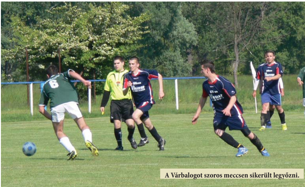
A Várbalogot szoros meccsen sikerült legyőzni.