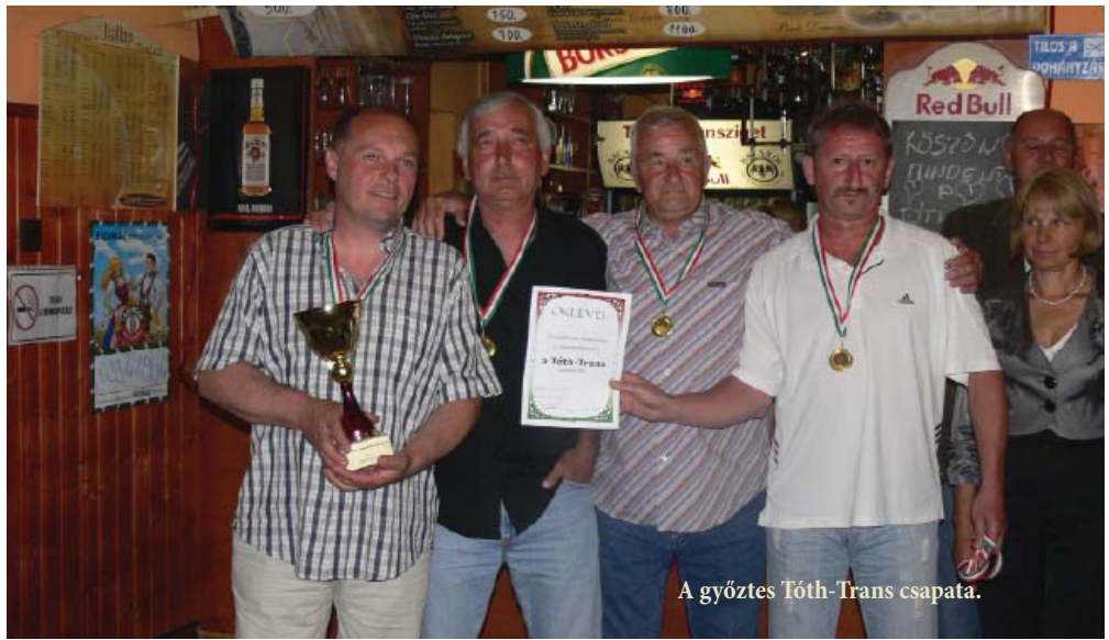
A győztes Tóth-Trans csapata.