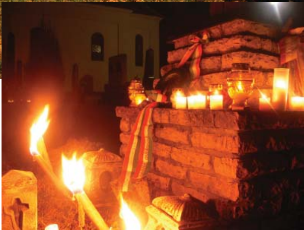
Az 1943-ban a Don-kanyarnál, az urivi áttöréskor elesett kunszigeti katonákra emlékeztünk január 12-én szerdán a temetői kopjafánál.