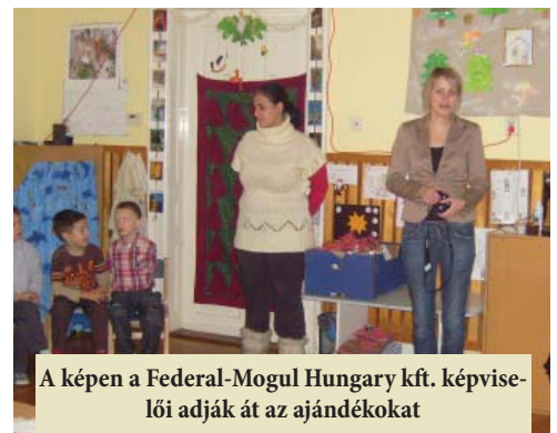
A képen a Federal-Mogul Hungary kft. képviselői adják át az ajándékokat

Február hónapban Balázs napkor figyeltük az időjárás változását: vajon kibújik-e a medve a barlangjából? Hosszú lesz-e még a tél? Kis-középső csoportosaink mackógyűjteménnyel készültek a jeles napra. A tél végén a farsangi mulatságra való készülődés veszi át a főszerepet az óvoda életében. Intézményünkben 2011. február 18-án pénteken tartjuk hagyományos farsangi jelmezbálunkat.