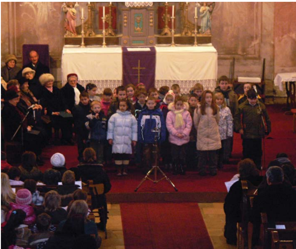
Ahogy 2009-ben, úgy 2010-ben is közösen rendezte meg karácsonyi ünnepélyét a Szigetgyöngye Nyugdijas Klub és a helyi iskola. December 19-én a templom zsúfolásig megtelt a közös karácsonyi ünneplésre.