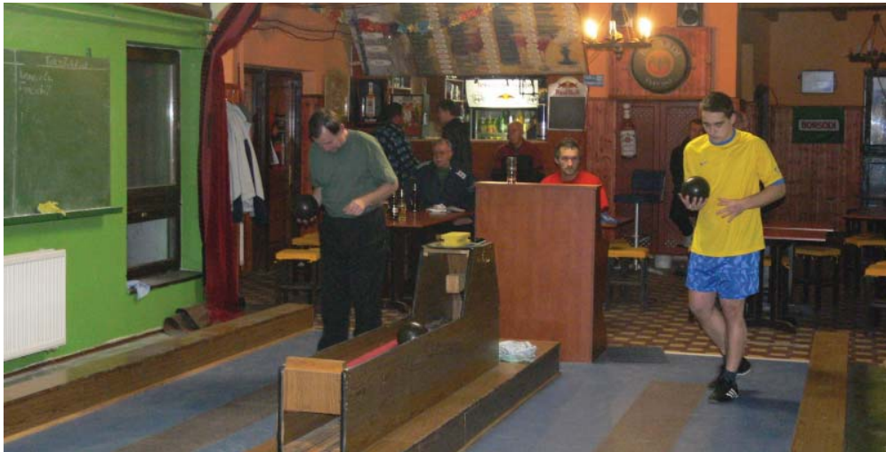
Képünk a T-Boys és a Tökös Tekések összecsapáson készült.