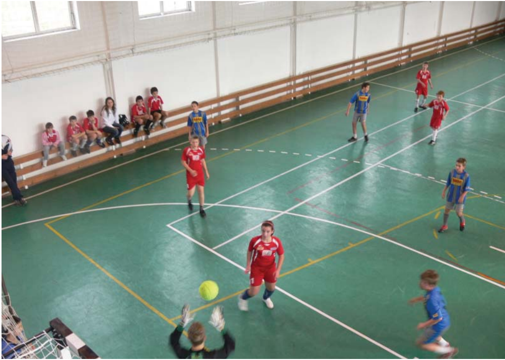
A Kunsziget A - Györladamer mérkőzés egy pillanata.