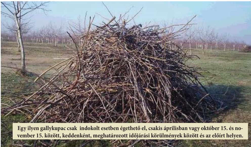
Egy ilyen gallykupac csak indokolt esetben égethető el, csakis áprilisban vagy október 15. és november 15. között, keddenként, meghatározott időjárási körülmények között és az előírt helyen.