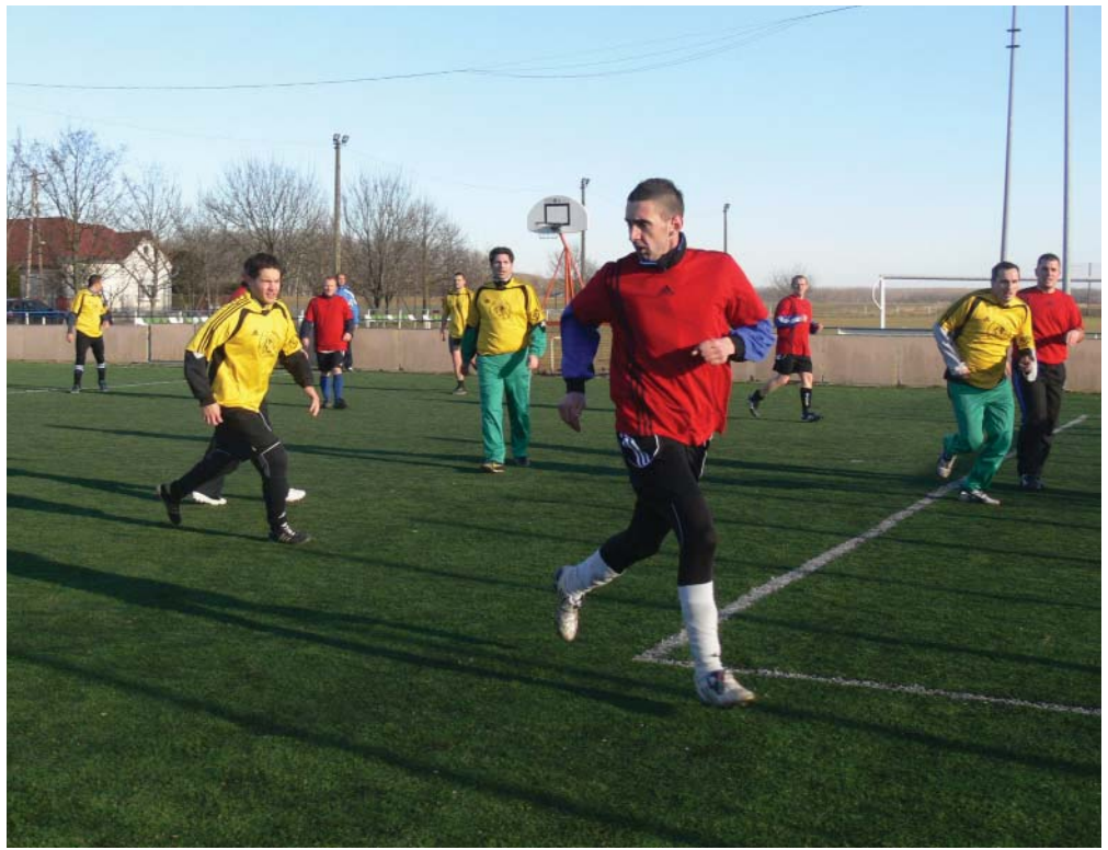
A győri Szarvas utcai gázrobbanásban megsérült három tűzoltó javára ajánlották fel a február 12-én Kunszigeten rendezett labdarúgó torna bevételeit. A tornán kilenc csapat vett részt, közülük negyedik helyen a rendőrség végzett, a tűzoltók a harmadikak lettek (képünkön a bronzmeccs egyik pillanata). A döntőben a Kunsziget ellen az Abda győzedelmeskedett.

A következő hetekben, várhatóan március elején újabb tanfolyamok indulnak mindkét nyelvből 40 órában, melyre még várunk jelentkezőket, érdeklődőket. Jelentkezni lehet a Teleházban, a kunszigetitehaz@yahoo.com címen és a 06 20/ 441 12 39-es telefonszámon.