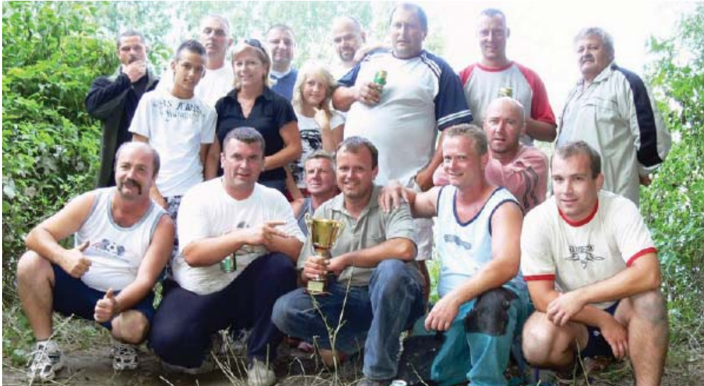
Képünkön csapatunk tagjai és a szurkolók.