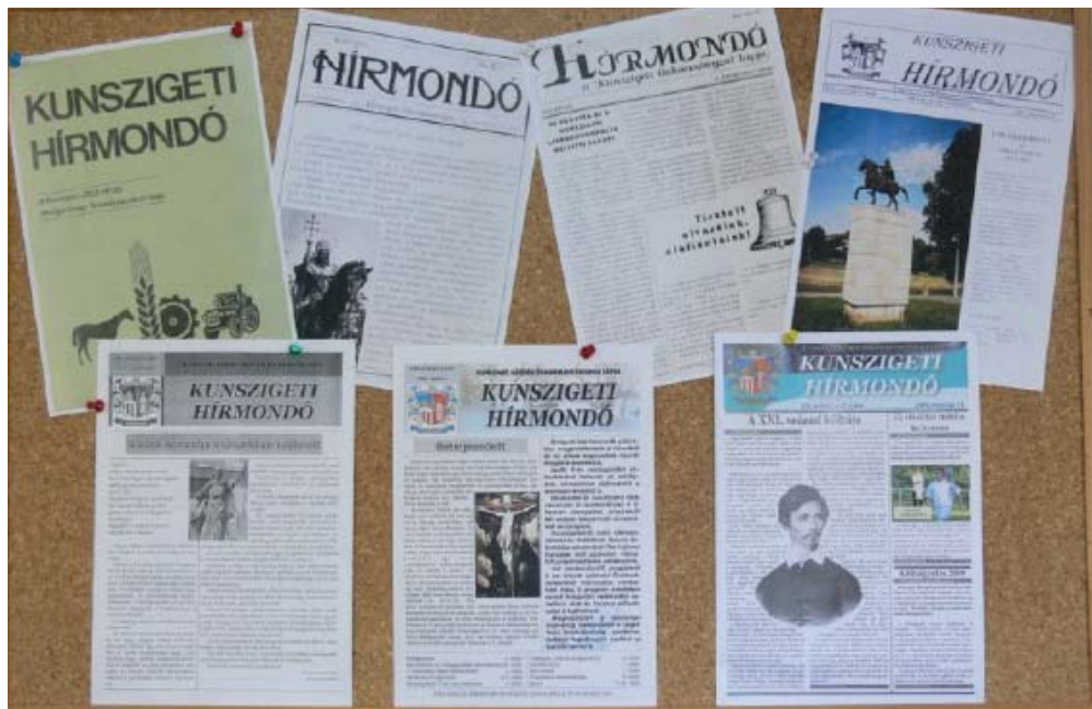
Hírmondók címlapjai egykor és ma.