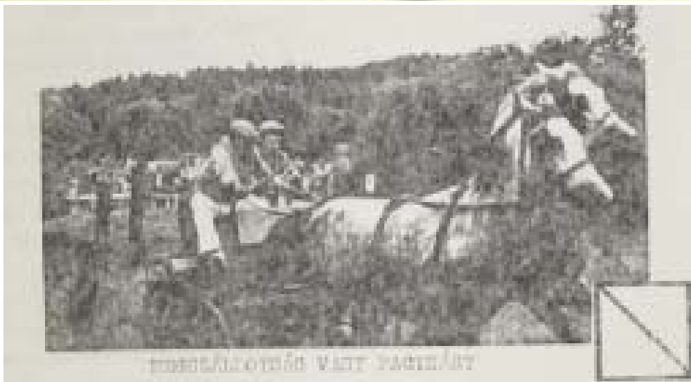
1990 júliusában cikket olvashattunk a termelőszövetkezet által szervezett fogathajtó szakosztályról és annak sikereiről Megszállottság vagy pacizás? címmel.

Az 1991-es júniusi Hírmondóban olyan történt, amire máig nem adatott példa (és reméljük, nem is lesz több ilyen): címdalton egy építőipari PR-cikket olvashattak az olvasók, holott ennél jóval komolyabb és fontosabb témák is voltak az újságban - például a társadalombiztosítás reformjáról vagy a változó munkajogi szabályozásról. Mai szemmel - Kunsziget történetét is vizslatva - a legérdekesebb cikk azonban az önkormányzati hírek között bújlik meg a 10. oldalon: egy kunszigeti küldöttség az előző évben itt járt erdélyi diákok meghívásának eleget téve készülő Backamadarasra. A látogatás célja az volt, hogy testvérkapcsolatot alakítsanak ki a két