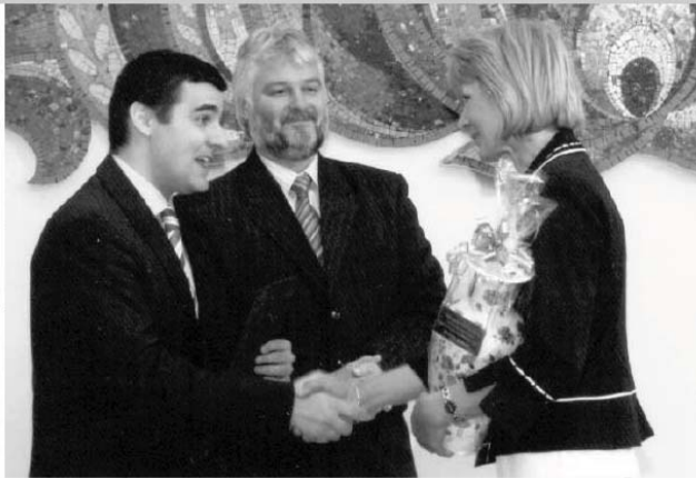
Az FVM államtitkára Tápiógyörgyén adta át a díjat.

község pártot be 2007-ig kormányzati fejlesztési Művelődési és Sportközpont felhívására. A célja olyan tevékenységek bemutatása, amelyek a falu fejlődéséhez járulnak hozzá.