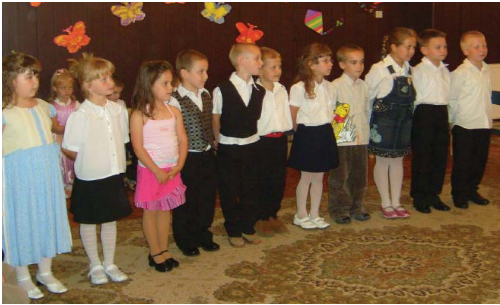
A búcsúzó nagycsoportosok