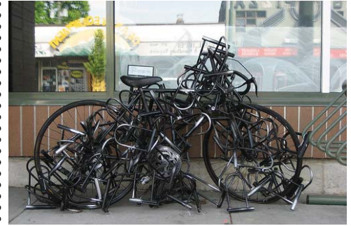
Biztos ami biztos