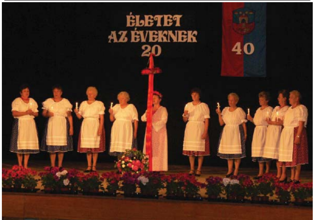
Kapuvár várossá nyilvánításának 40. évét és a 20 éves Életet az éveknek! szervezetet köszöntötték a megye nyugdíjas klubjai május utolsó szombatján. Képközlő a kunszigetiek pütkösdőlője.

Érdeklődni lehet személyesen a teleházban vagy a 96/552-010-es telefonszámon.