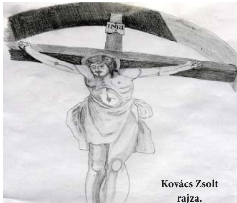
Kovács Zsolt rajza.