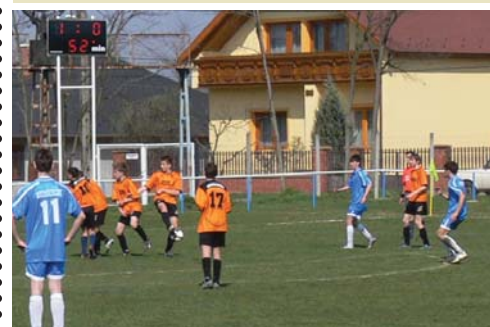
Sokáig volt 1-0 az eredmény.

A Kunsziget U16-os csapata a tabella hetedik helyén áll a győri B csoportban. Három hazai meccs következik most a serdülőcsapatnak. Főként Györszemere és Koroncó ellen lehet keresnivalónk (előbbi csapat több gólt kapott és kevesebbet rúgott, mint mi, utóbbi csapatot pedig ősszel idegenben legyőztük).