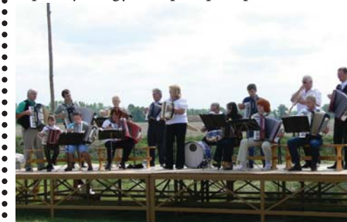
A kimlei harmonikások idén is fellépnek.

A megszokott rendezvények mellett új színfoltot jelenthetnek az abdai Royal Rangers kaland- és kézműves játéka. Lesz mesejáték, sok-sok zene és tánc - fellép egy világ- és Európa-bajnok győri hip-hop csapat is.