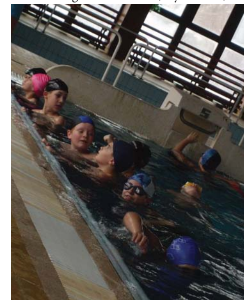
Úszás - Iskolánk nagy hangsúlyt fektet gyermekeink egészséges fejlődésére és mozgására, ezért a 3. és 4. osztály hétfőnként rendszeresen jár úszni a győri GYÁÉV uszodába.

Felső tanulók között hirdetett versenyt februárban a TITOK, London Bridge név alatt. Az 5-8. osztályokban osztályonként két-három tanuló képviseltette magát. A verseny írásbeli megméretetés volt, nyelvtanra, szó-