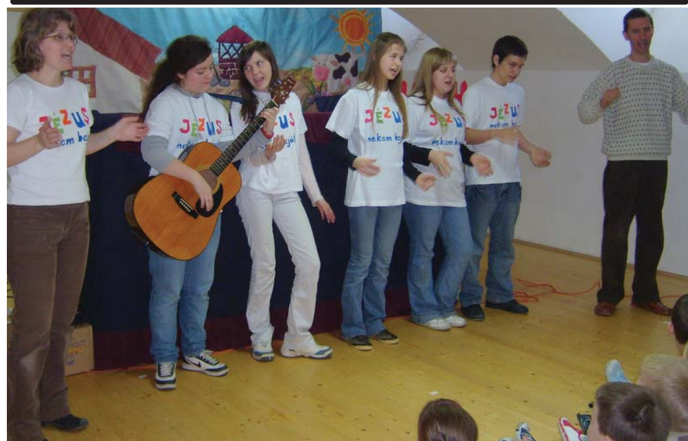
A győri Palánta Gyermek- és Ifjúsági Keresztény Misszió tagjai bábelőadással látogattak Kunszigetre. Bábjátékuk a húsvéti ünnep üzenetét hozta el az óvodásoknak és az alsós iskolásoknak. Köszönjük a szép előadást, nagy élményt jelentett számunkra.

Végezetül játékos feladatokat oldottunk meg, igazolva a hallottak helyességét. A másfél óra gyorsan elszaladt, szinte észre sem vetjük az idő múlását.