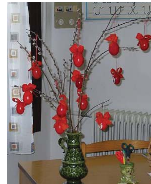
Húsvétra készülünk, mely ünnepünknel a hagyományos piros tojás igazi hungaricum, ezért a rajzórán tanulóink megismerkedtek a tojásfűvással és festéssel. Képen a 3. osztályosok tojásfája.

Elsős és másodikos tanulóink készülnek az április végi angol nyelvi mondókaversenyre.