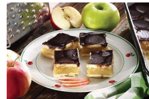
Kekszes-almás süti, sütés nélkül

A liszt és sütőpor keverékéhez a sőt, a margarint, a tojást, az ecetet, a vizet hozzáadva sima tésztát gyúrunk. Hideg helyen fél órát pihentetjük. A sonkát és a tojást kis kockákra vágjuk és összekeverjük a fölvert tojásfehérjével. A tésztát fél centi vastagra nyújtjuk, és öt centiméter átmérőjű korongokat szaggatunk belőle, a közepére egy kiskanálnyi töltelékkel teszünk, félbehajtogatjuk, és a széleit lenyomkodjuk (célszerű villával). A tetejét bekenjük egy kis tejjel elkevert tojássárgájával. Kiolajozott sütőlapon előmelegített sütőben 10-15 percig sütjük 180-200 °C fokon.