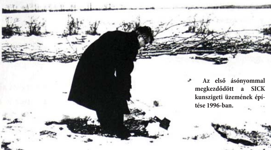
Az első ásonnyommal megkezdődött a SICK kunszigeti üzemének épí- tése 1996-ban.