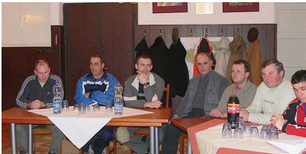
Civil szervezetek képviselői a fórumon.