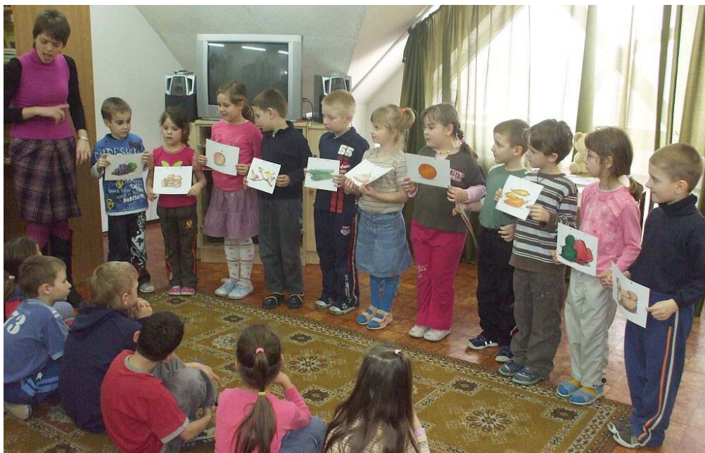
Nagy élményt jelentett számukra az iskolában tett látogatás, ahol magyar órán és angol órán vehettek részt a gyerekek.

Március 11-én a győri sátras uszodában úszótanfolyam indul az érdeklődő nagycsoportosaink számára. A tanfolyam tíz foglalkozásból áll, a gyerekek már nagyon várják az úszásoktatás kezdetét.