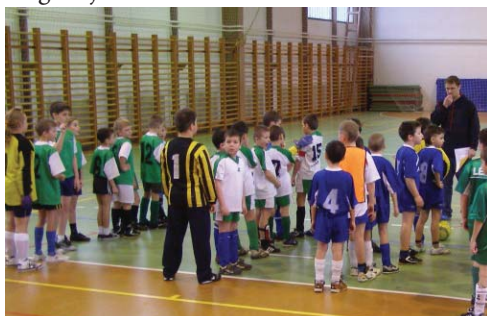
A kunszigeti U-9-es csapat a kép bal szélén.

A jövőben szeretnénk már első helyet is elérni, de ehhez sok edzésre van még szükség. Alig várjuk már a következő tornát!