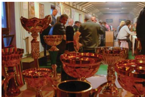
Idén is sok kupa vár majd kiosztásra, akárcsak 2008-ban.