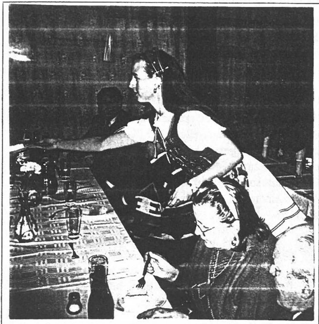
Fiatalok osztják a vacsorát

Színház és jó hangulatú kirándulások sora teszi derűsebbé az idős emberek életét. A házi szociális segítségnyújtási szolgálat pedig annak a tizenhat, magát nehezen ellátó nyugdíjasnak nyújt támaszt, akik már otthonukhoz kötöttek élnek.