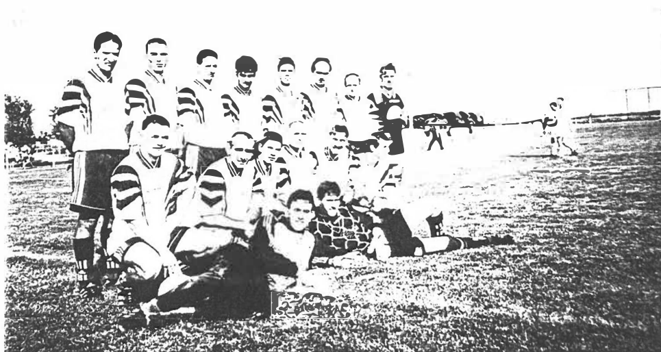
Az első mérkőzésre felállt csapat tagjai balról jobbra:

Az utánpótlás csapatok sorsolása azonos a felnőtt csapatok sorsolásával. Kezdesi idő 2 órával korábban a felnőtt mérkőzés előtt.