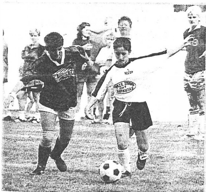
A focitornán nemcsak a közvetlen ellenfelet, de a nagy meletget is le kellett győzni.