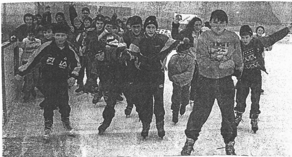
A viski gyerekek önfeláldozóan csúszkáltak a győri műjégpályán