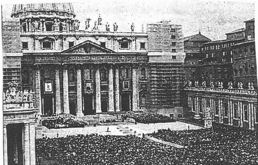
Zarándokok 1997. november 9-én a Szent Péter téren