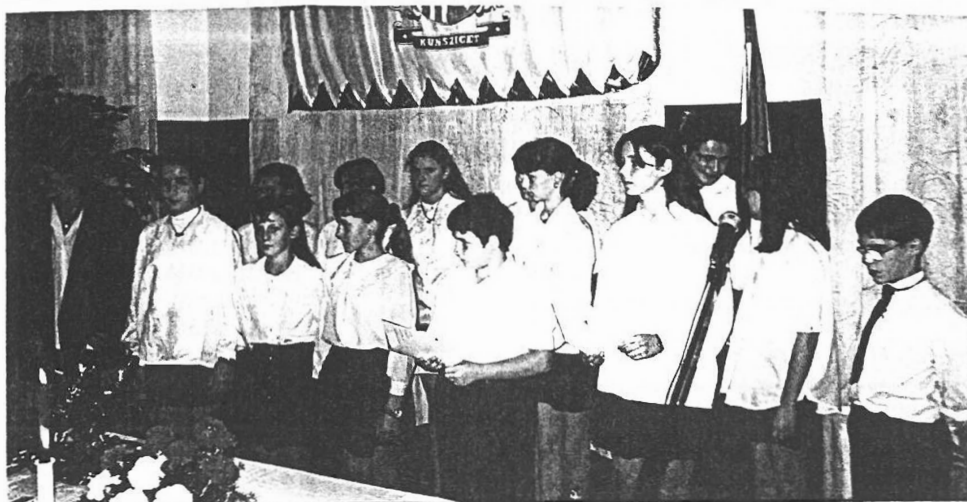
Az általános iskola énekkara