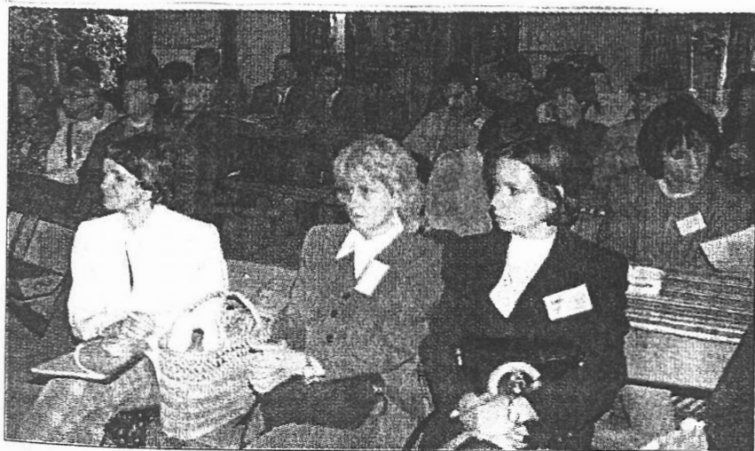
A konferencia résztvevői a vízi turizmus és a falusi vendéglátás témakörében hallhattak előadásokat.