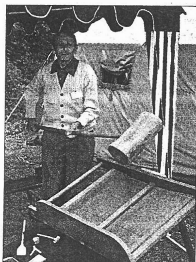
Az aranyosok hagyományos technikáját is bemutatták Darnózselin.