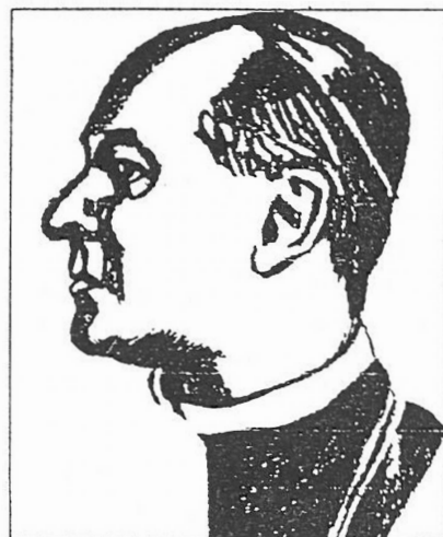
Apor Vilmos püspök