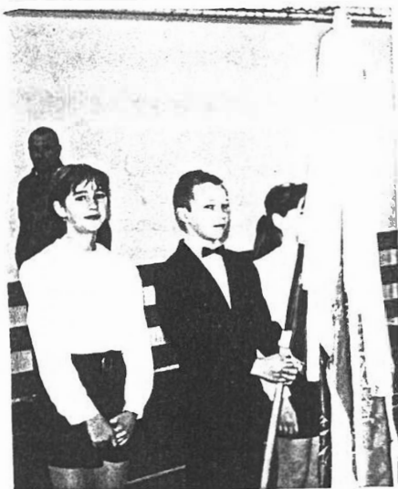
A megnyitó pillanatai

A sportszámokban 5 lány- és 6 fiúcsapat sorakozott fel az ünnepi megnyitóra. Abda. Dunaszeg, Györszemere. Mecsér. Mosonszentmiklós. Öttevény és Kunsziget iskoláiból jöttek megmérkőzni egymással a fiatalok.