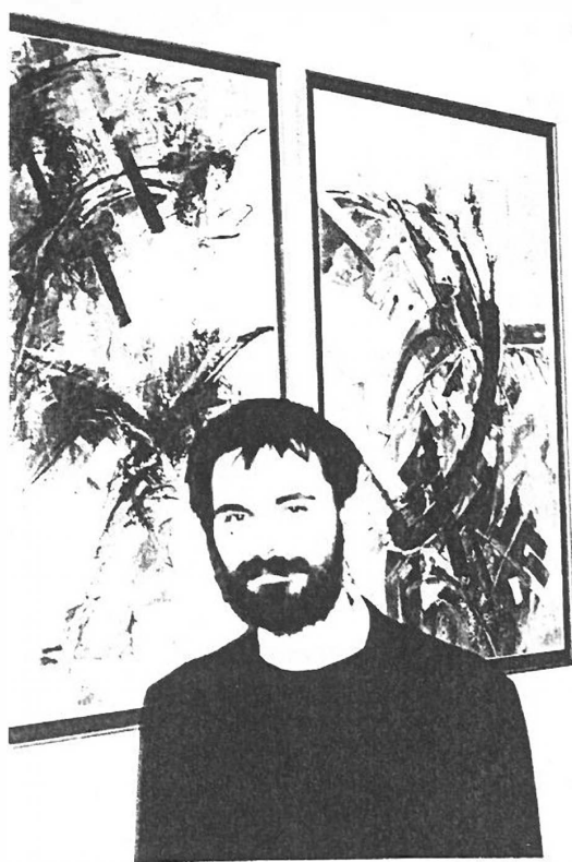
A művész képei előtt

A megnyitón szép számú érdeklődő jelent meg, közöttük győriek és kunszigetiek is. A kiállítás április 17-én zárult.