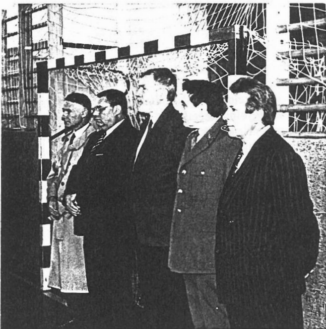
A vendégek egy csoportja