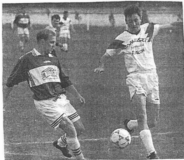
Jelenet a mérkőzésről.