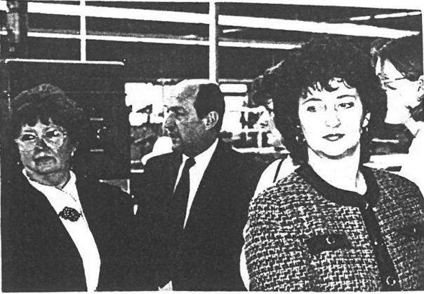
Gyárlátogatáson a SICK cégnél