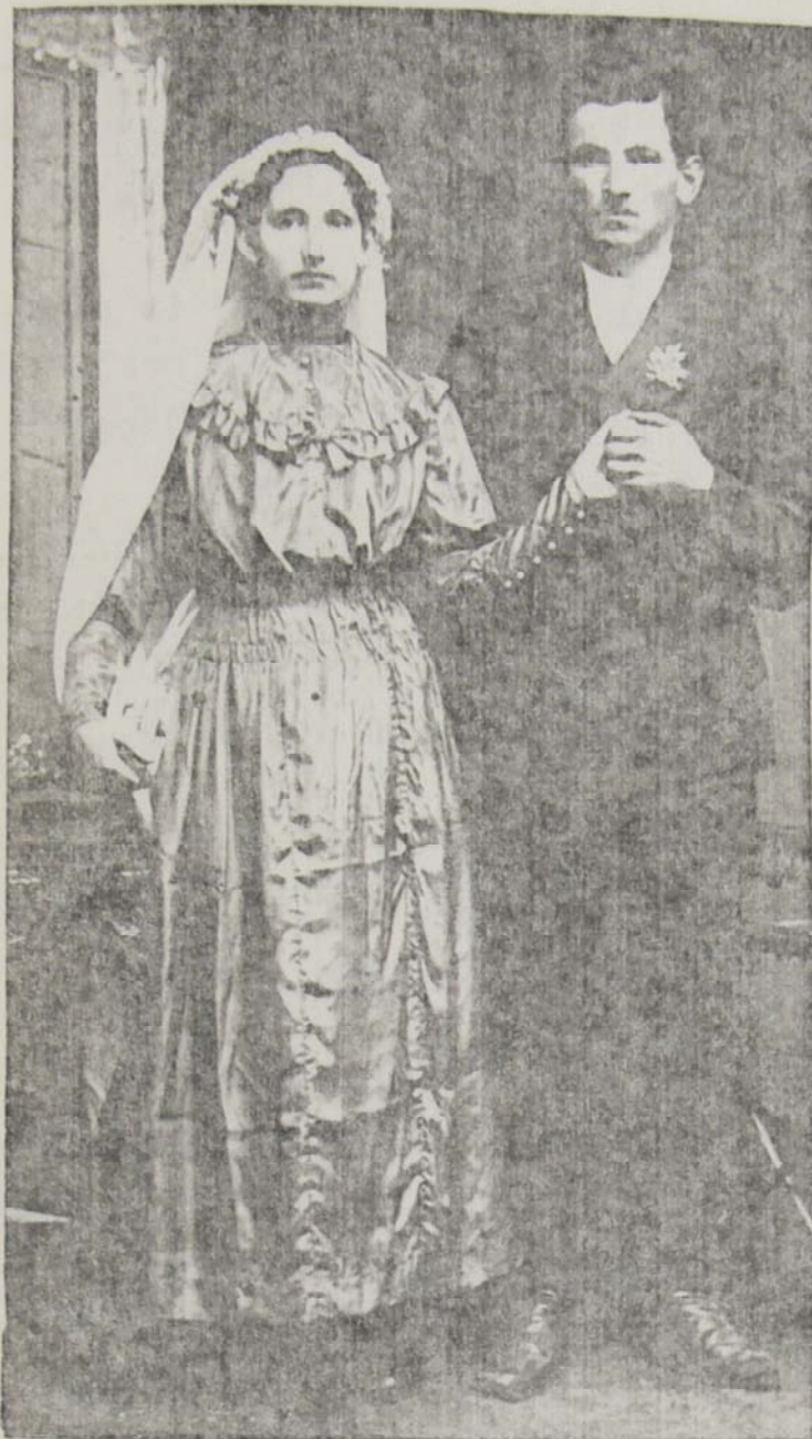
Esküvői kép a század elejéről

semet, és jöjjenek el oda, ahol szerdán lesz a lakoma és megszólal a muzsika. Dicsértessék a Jézus Krisztus!"