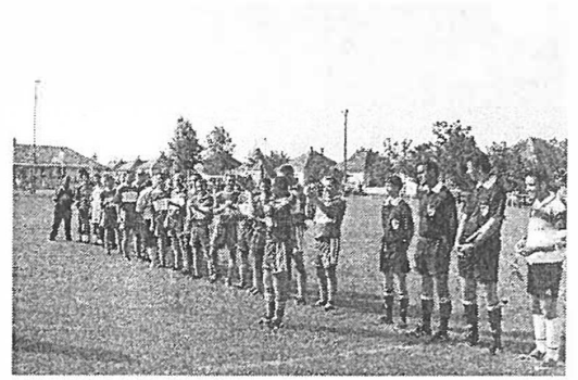
Labdarúgócsapatunk bajnoki címet szerzett