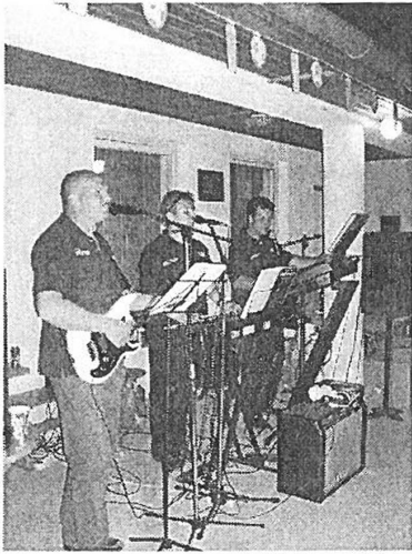
A zenei életet a MÁZLI színesíti tavasz óta