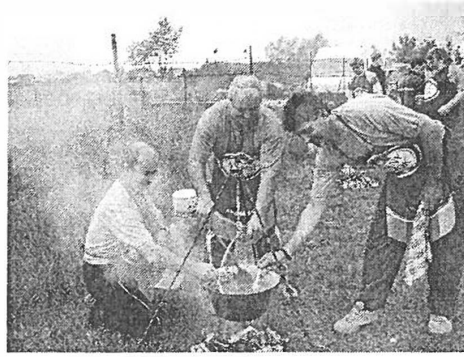
Pörköltfőző versenyt rendeztünk a Majálison