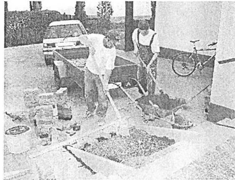
A Kultúrotthon bejáratához feljáró épült