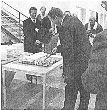
Felavatták a Federal Mogul új üzemsarnokát és irodahelyiségeit