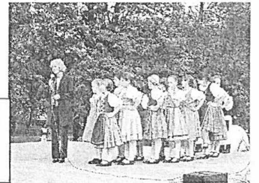
Szüreti Nap sok-sok táncsal és a falu színpadának „premierjével”