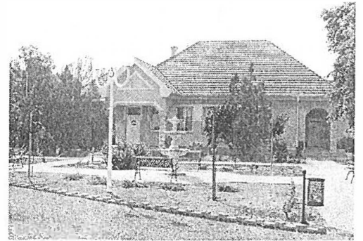
Megszépült a Kossuth tér