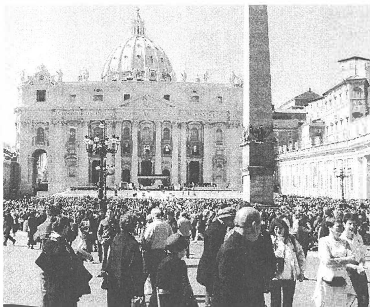
A Szent Péter Bazilika előtti tér a boldoggá avatáskor