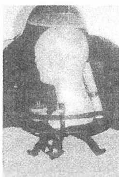
Szent Erzsébet fejereklyéje

Első napunk utazással telt el Ausztria és Olaszország szép hegyes vidékén és síkságon átvezetve Orvietóig, a szálláshelyünkig.