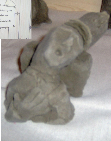
Tilinger Gábor alkotásaiért különdíjat kapott.