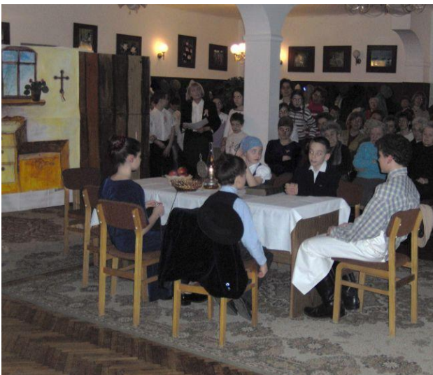
Irodalmi összeállítással emlékeztünk meg az 1848-as forradalomról és Petőfi Sándorról, melyet az iskola tanulói adtak elő.