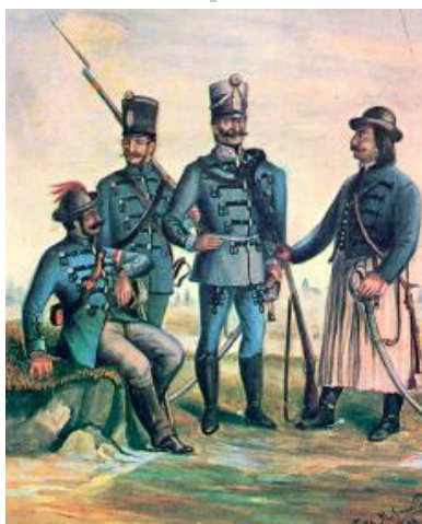
Tóth Molnár Ferenc akvarellje

A véres és hősi harcok elkerülték falunkat, de a megszállás, a katonatartás sok kárt okozott. Az első megpróbáltatás 1848. október 5-én érte a