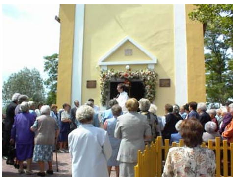
Júniusban fejeződött be a Szent Antal kápolna felújítása