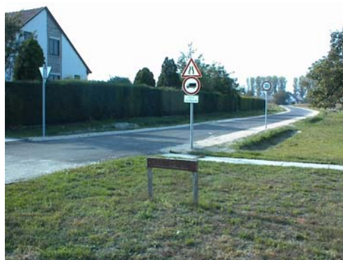
Augusztusban megépült teljes hosszában a Kertes utca, megtörtént a telkek közművesítése

Egy újabb évet hagyunk magunk mögött. 2002 mindenkinek mást hozott, vannak azonban események, amelyekre talán mindannyian emlékezünk. Az elmúlt év emlékezetes történéseiből készült képes összefoglalót láthatják ezen az oldalon.