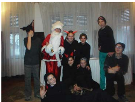
Az iskola számos rendezvénye közül egy: a Mikulás-buli