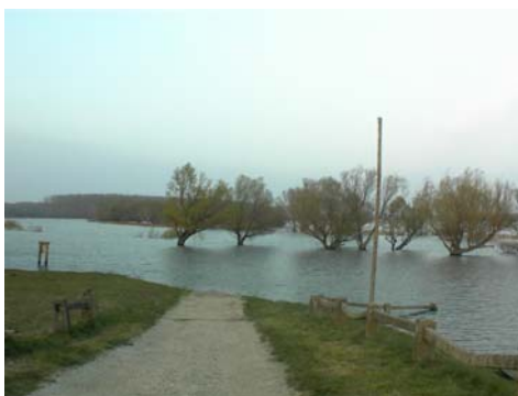
A Mosoni-Duna márciusban és augusztusban alaposan megáradt