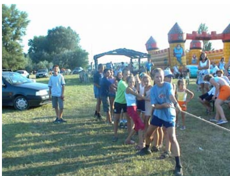
Remek családi kikapcsolódást hozott a júliusi Dunaparti Fesztivál