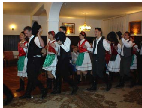
Bár az eső elmosta az októberi szüreti felvonulást, a tánc a Kultúrthonban nagyon hangulatos volt