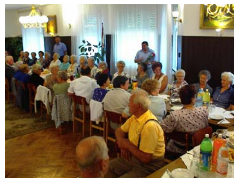
Júliusban ünnepelte megalakulásának 10. évét a Nyugdíjas Klub