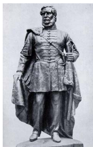
Szobor a Hősök terén, Budapesten