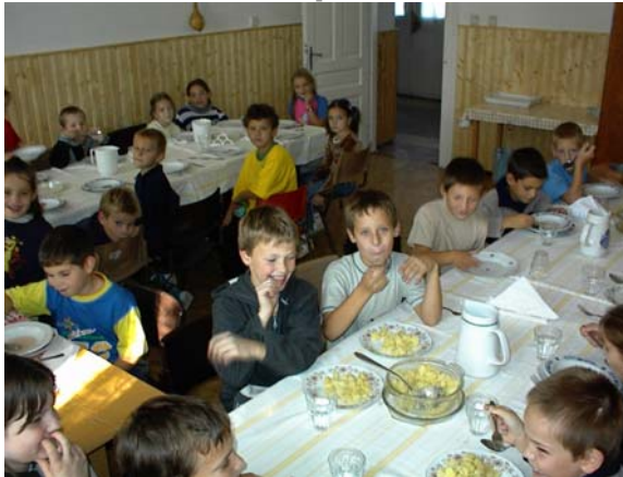
Ebéd a felújított ebédlőben

A diákok délelőtti leterheltsége az elmúlt évekhez képest némileg csökkent – köszönhetően az egyes évfolyamokra központilag maximált heti óraszámok-