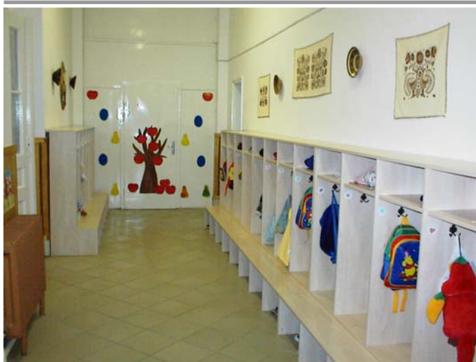
Felvételünk az óvoda megújult folyosóján készült

A kunszigeti Tündérvár Óvodában a nyári szünet alatt felújítási munkálatok történtek: az óvoda folyosója kapott új burkolatot és új öltözőszekrények készültek.