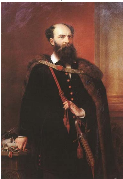
Gróf Batthyány Lajos, az első felelős magyar kormány miniszterelnöke, akit Pesten végeztek ki 1849. október 6-án

A hősökön kívül azonban magunknak és gyermekeinknek is tartozunk azzal, hogy mi döntünk községünk életéről és vele együtt a saját sor-