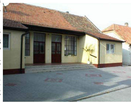
A Kultúrotthon udvara