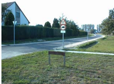
A Kertes utca új burkolata

A beruházás megvalósítására Kunsziget Község Önkormányzata, Képviselőtestülete pályázatot adott be az önkormányzati törzsvagyonhoz tartozó út kialakítása