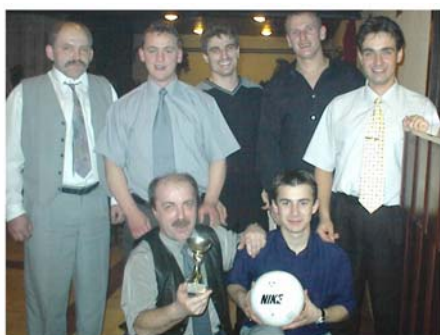
A győztes csapat képviselői

A megérdemelt díjakat a helyezettek a március 9-én tartott Sportbálon vették át.