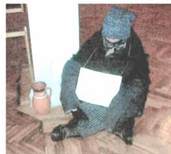
EGY PAPTAGI NYUGDÍJAS

Klubunk támogatását kérve, új tagok jelentkezését várva tisztelettel: